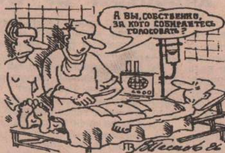
Рис. В. ПЕСКОВА.

Подробно об ответах обоих претендентов читайте в следующем номере газеты.