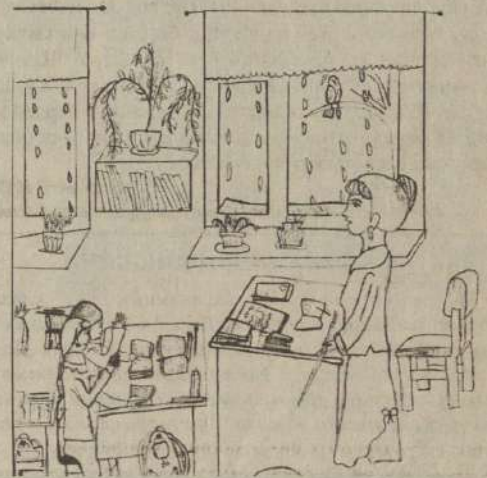
"КИЧЭЭЛ ҮЕЗИНДЕ" Долума СОДУНАМНЫҢ чурраан чуруу.

даа өөредип турар. Школавыска эртип турар бүгү-ле байырлалдарга, мөөрейлерге, маргылдааларга күзөлдүвис-биле кириш-турар бис. Мен бодум школага эрткен "Саазын делегейи" деп конкурска эки киришкеш, оон кожуунга база киришкеш, шаңнаттым.