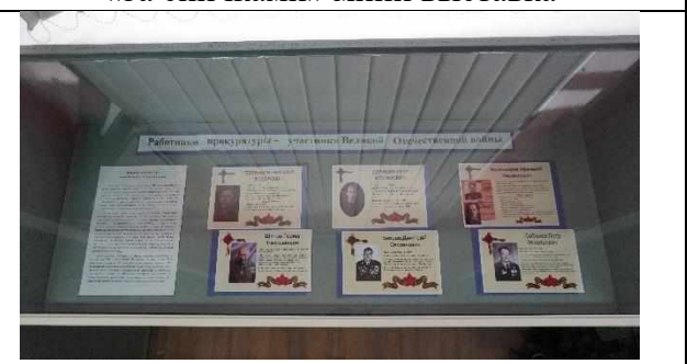
«Работники прокуратуры во время ВОВ»