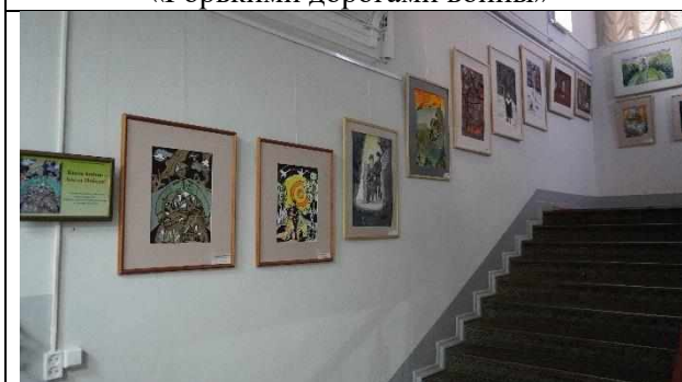
«Была война, была победа» (работы учащихся ДШИ и ДХШ)