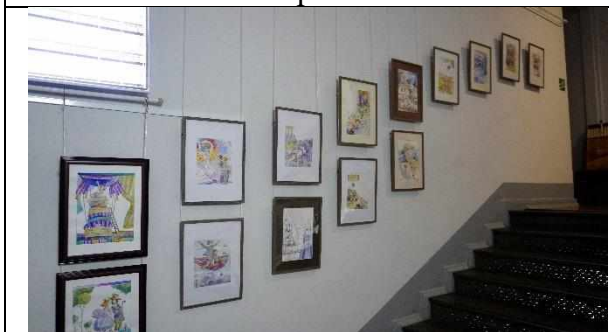
«Искусство книжной иллюстрации. Графика Андрея Крысова»