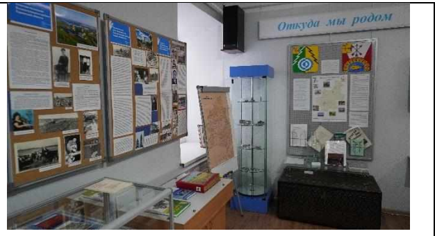
Откуда мы родом (из фондов музея и личных архивов жителей района)