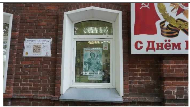
Выставка плакатов ВОВ