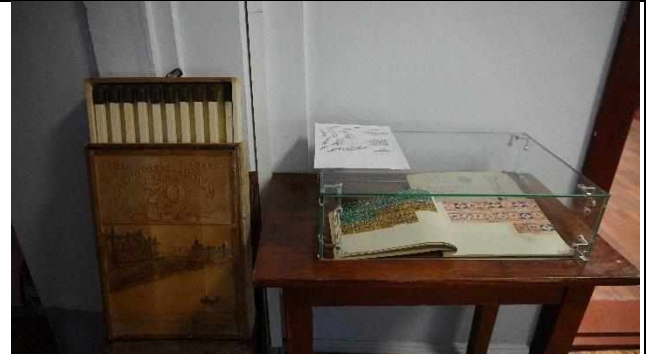
«За спичками» мини выставка