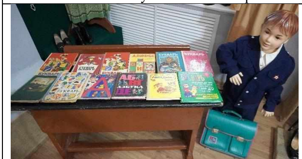
«Буквари разных народов»