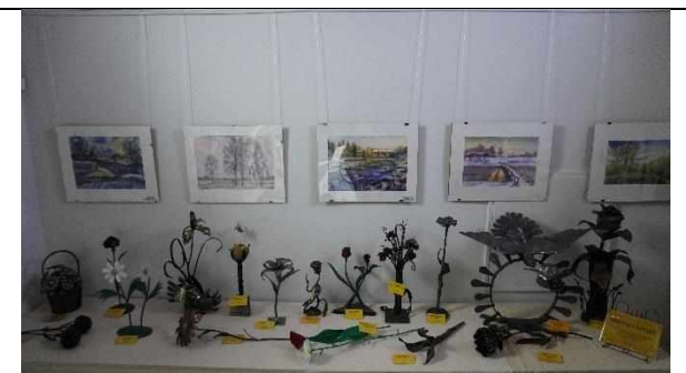
«Цветы герою» (работы кузнецов России)