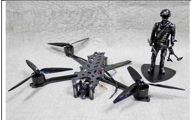
Мини выставка «СВО»