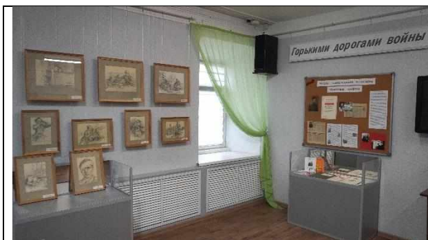
«Горькими дорогами войны»