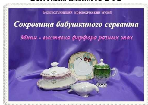
«Сокровища из бабушкиного серванта»