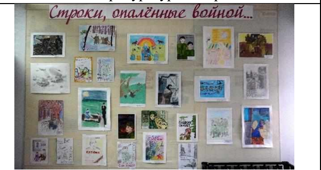
«Строки, опалённые войной» (выставка рисунков учащихся школ района)