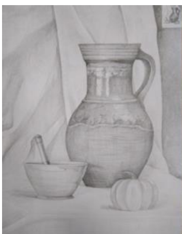
Рисунок (в переводе с немецкого rißen – резать, чертить) – изображение на плоскости, созданное графическими средствами . Рисунок – структурная основа зрительно воспринимаемой формы. Основа зрительного образа воспринимаемого объекта. В этом значении термин "рисунок" близок понятию абрис, контур, очерк. Художник раннего итальянского Возрождения Пьеро делла Франческа в «Трактате о живописной перспективе» писал: «Под рисунком разумею мы профили и очертания, кои заключаются в вещи».

Однако рисунок есть не только «очертание», но также представление конструкции предмета в его трехмерных качествах. Рисунок как структурный образ наблюдаемого объекта складывается в сознании рисующего ещё до начала изобразительного процесса, и поэтому он несет в себе рациональное, интеллектуальное начало.