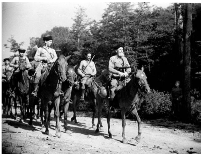
Казаки корпуса генерал-лейтенанта Н.Я. Кириченко на марше

Вскоре казачьи сотни реорганизуются в воинские подразделения, отвечающие требованиям современной войны: сабельные и пулеметные эскадроны, артиллерийские и минометные батареи. В начале 1942 года две вновь сформированные кубанские казачьи кавалерийские дивизии зачислены в кадровый состав армии. Совместно с двумя донскими казачьими дивизиями из них образован 17-й кавалерийский корпус (позже донские дивизии станут основой для формирования 5-го Донского гвардейского казачьего кавкорпуса).