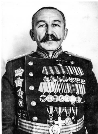
Советский военачальник, генерал-полковник, Герой Советского Союза Павел Алексеевич Белов

В июле 1941 года на фронт в район Ярцево (Смоленская область), были переброшены с Северного Кавказа 50-я и 53-я кавдивизии (из кубанских и терских казаков), составившие 3-й кавалерийский корпус Л. М. Доватора. 3 тысячи конников совершили дерзкий рейд за линию фронта, за 10 дней прошли 300 километров, погромили тылы 9-й германской армии и успешно вырвались к своим.