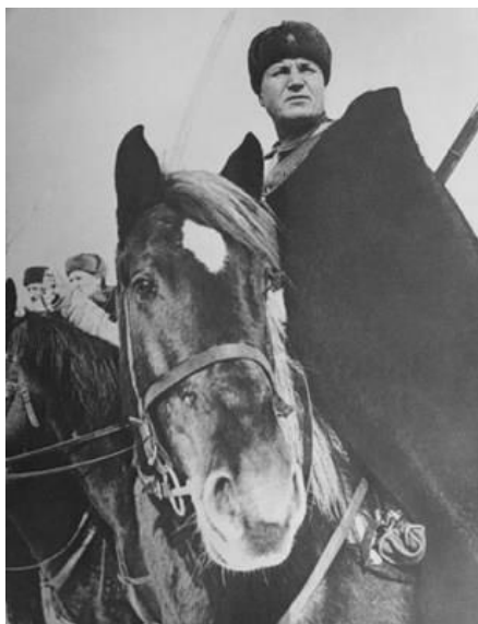
Советский военный деятель, генерал-майор. Герой Советского Союза Лев Михайлович Доватор

Подвиг казаков у деревни Федюково (Волоколамский район) - это одна из страниц казачьей боевой Славы! В ходе операции «Тайфун» в ноябре 1941 года немецкие войска продолжали находиться в опасной близости от Москвы. Ожесточенные бои проходили на протяжении всего фронта.