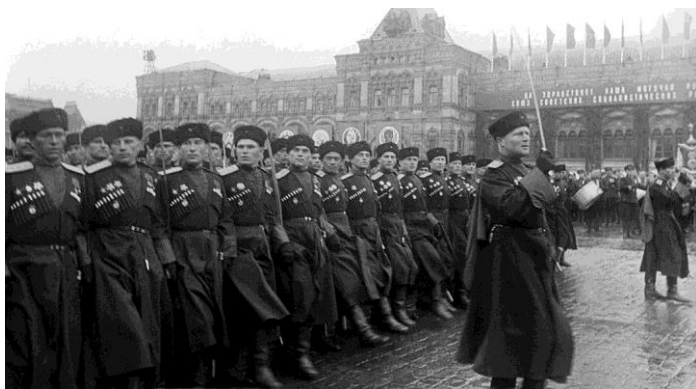
Казачи на Параде Победы 24 июня 1945 года

Казачки, старики, ребятя, оставшиеся в тылу, пахали землю, становились за станки заводов, чтоб накормить страну и армию.