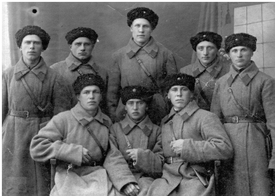
Казачи 37-го полка Кубанской армии

Но, отступить было некуда. Проникновение противника с тыла – это верная угроза всем обороняющимся войскам, защищавшим столицу. Поэтому, проявляя примерную отвагу и мужество, казаки сражались с немецко-фашистскими захватчиками героически. Фашисты стали нести большие потери, как солдат, так и танков. Бронетехнику стойкие воины забрасывали «коктейлями», а пехоту рубили шашками.