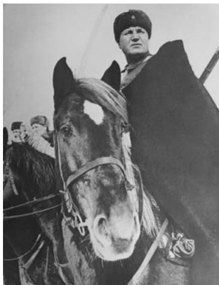
Советский военный деятель, генерал-майор. Герой Советского Союза Лев Михайлович Доватор

Подвиг казаков у деревни Федюково (Волоколамский район) - это одна из страниц казачьей боевой Славы! В ходе операции «Тайфун» в ноябре 1941 года немецкие войска продолжали находиться в опасной близости от Москвы. Ожесточенные бои проходили на протяжении всего фронта.