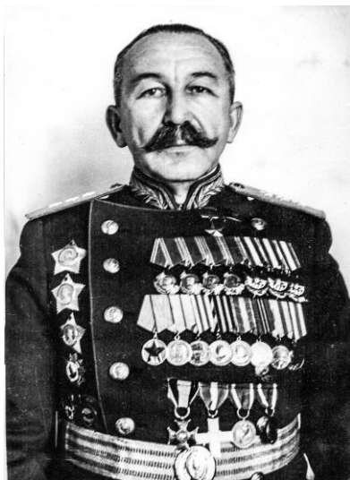
Советский военачальник, генерал-полковник, Герой Советского Союза Павел Алексеевич Белов

В июле 1941 года на фронт в район Ярцево (Смоленская область), были переброшены с Северного Кавказа 50-я и 53-я кавдивизии (из кубанских и терских казаков), составившие 3-й кавалерийский корпус Л. М. Доватора. 3 тысячи конников совершили дерзкий рейд за линию фронта, за 10 дней прошли 300 километров, погромили тылы 9-й германской армии и успешно вырвались к своим.