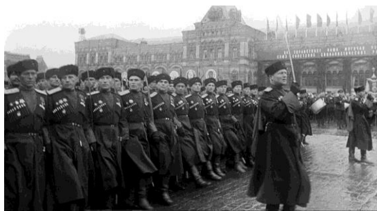
Казачи на Параде Победы 24 июня 1945 года

Ю.А.Гагарин сказал: «Без полетов Бахчиванджи не было бы 12 апреля 1961 года».