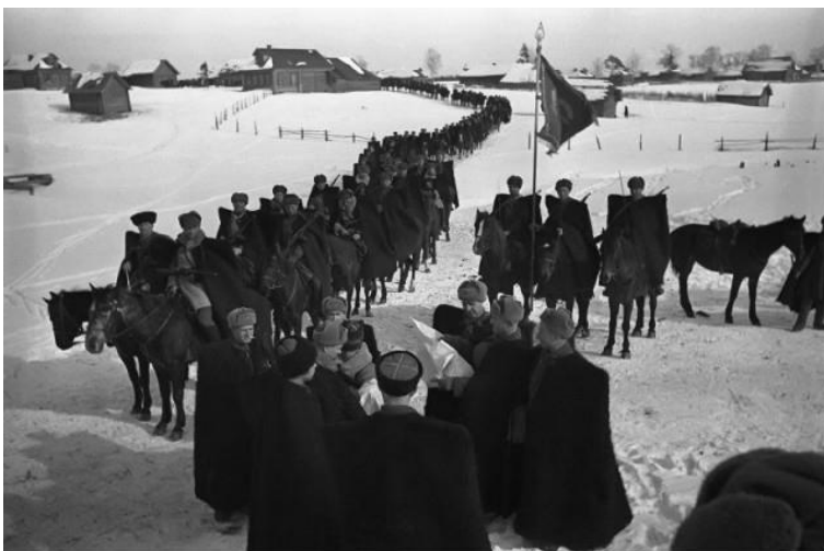
Генерал Л.М. Доватор и его казаки

Понимая стратегическую важность этого пункта советской обороны, немцы принимали несколько безуспешных попыток штурма батарей, располагавшихся на высоте. После этой серии неудач они решили сменить тактику и зайти в тыл к оборонявшимся с юга.