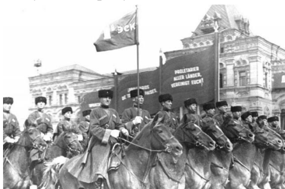
Казаки на параде 1 мая 1937 года

В предвоенный период началось создание кубанских казачьих частей. 20 апреля 1936 года вышло постановление ЦИК СССР «О снятии с казачества ограничений по службе в РККА». На основании положения вышел приказ Наркома обороны маршала К.Е. Ворошилова № 061 от 21 апреля 1936 года, в котором говорилось о переименовании ряда кавалерийских дивизий в казачьи. В числе прочих, в приказе были указаны 12-я территориальная кавдивизия Северо-Кавказского военного округа, ставшая Кубанской, и 6-я кавалерийская дивизия Белорусского военного округа, превратившаяся в Кубано-Терскую.