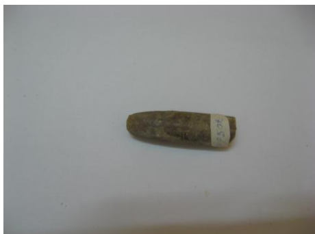
2. КП-705 1964г. Белемнит. Размеры: 1,2x5,5 см.