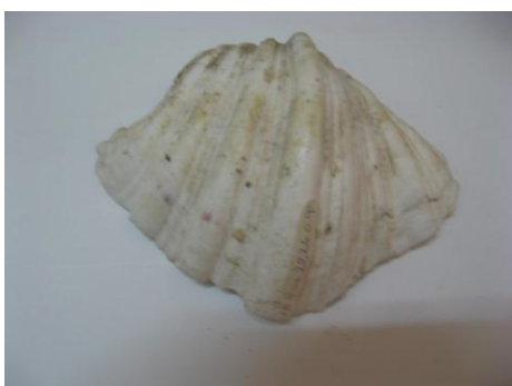
9. КП-2226 1968г. морская раковина.