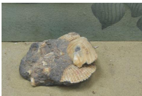
5. КП-2136/2 1967 г. Отпечаток раковины на камне. Найден в районе с. Барановка. Порода. (э.) Размеры: 12x8 см.