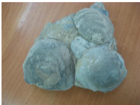
18. КП-4827 1978 г. Окаменевшие створки раковин семейства Ostreidae- Rusnodonte sinzowi . Определена Московским палеонтологическим музеем в 1978 г. Кайнозой, палеоцен. Дар. Размеры: 8х6 см.