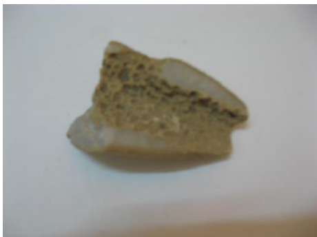
12. КП-3437 Губка морская. Третичный период, кайнозой. Размеры: 5x16 см.