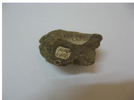
4. НВФ-4656 2002г. Отпечаток моллюска в виде лучевидных углублений на песчанике. Дар. Размеры: 7x5,5x3,5 см.