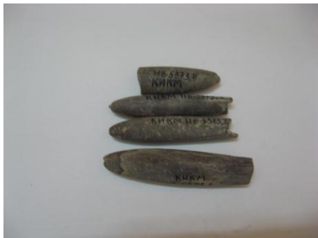
11. НВФ-5373/1-4 2011 г. Ростры белемнитов. Мезозойская эра. Дар. Размеры: 5,5x 1,8 см; 9x1,5; 8x1 см; 8x1,2 см.