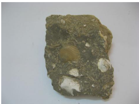
13. КП-3706 ( 4 шт) 1972г. Пироги с окаменевшими раковинами моллюсков. Найдены на Ураковом бугре в 40 км от Камышина. Дар. Размеры: 33x30x20 см; 15x12x8 см; 14x9x5 см.