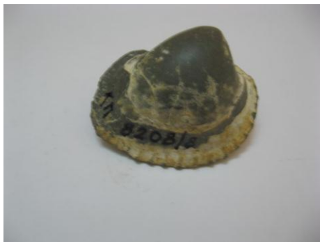
58. КП – 8208/8 Ядро раковины двустворчатого моллюска Кардита. Около 70-60 млн.л.н. Дар. Размеры: 6x5,2x3,8 см.