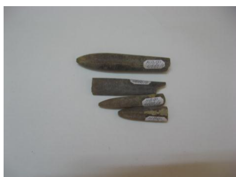
5. НВФ -4666/1-4 Ростры белемнитов из класса головоногие моллюски. Около 60 млн.л.н. Дар. Размеры: 9.1x1.3; 6.8x1.5; 6.1x1.2; 4.5x1.3 см.