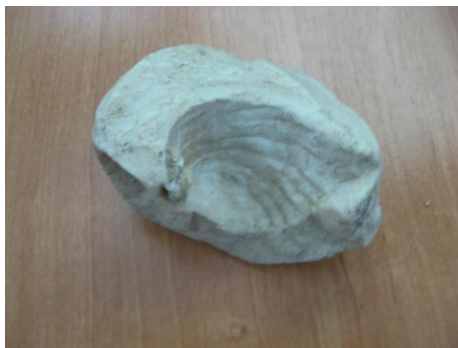
44. КП-6974/2 1992 г. Известняк с отпечатком брахиоподы. Палеозойская эра, около 400-300 млн.л.н. Дар. Размеры: 7.5x6 см.