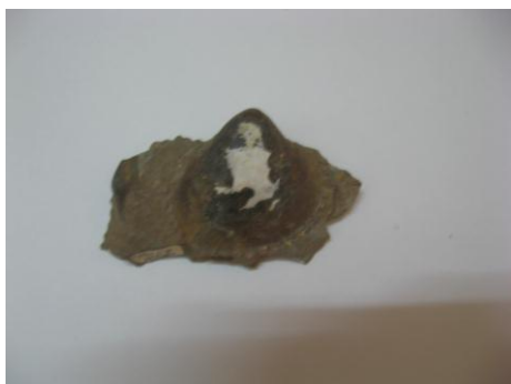
60. КП – 8350/11 Ядро раковины двустворчатого моллюска Кардита волжская . Песчаник.. Около 65 млн.л.н. Дар. Размеры: 9,4x5,6x3,2 см.