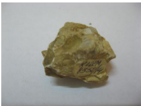
62. КП-8350/14 Фрагмент окаменевших моллюсков Турителлы. Около 65 млн. л. н. Порода песчаник. Дар. Размеры: 3,5x3,2x3 см.