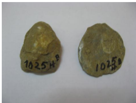
1. НВФ 1025/1,2 1969г. Раковины двустворчатых моллюсков.