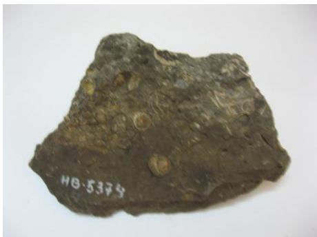
13. НВФ-5374 Ракушечник. Мезозой. Дар. Размеры: 23x15 см.