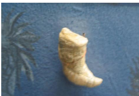
42. КП – 6974/1 Одиночный четырехлучевой коралл Ругоза Около 500-400 млн.л.н., палеозойская эра, силурийский период. Дар. Размеры: 3.5x1x6 см.