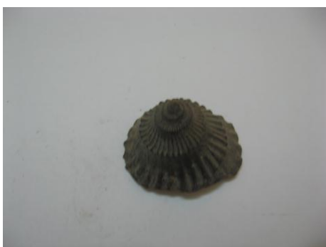
47. КП-7047/2 Часть ядра аммонита. Около 150 млн.л.н. Дар. Размеры: 3x4 см.