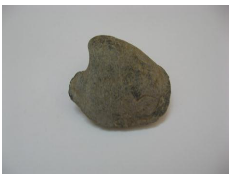
4. КП-708 1964г. Ракушка окаменевшая (внутренне ядро раковины), серого цвета. Размеры: 4,8x7 см.