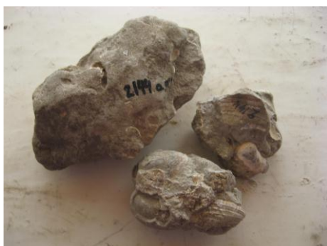
8. КП-2144 1968г. Камни с отпечатками ракушек. Найдены за оврагом севернее г. Камышина. Размеры: от 10x7 до 3x3 см.