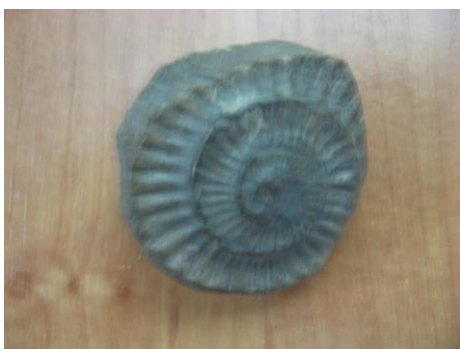
19. КП - 4828 Часть ядра аммонита. Определен Московским палеонтологическим музеем в 1978 г. Верхнеюрский период. Дар. Размеры: 3х3 см.