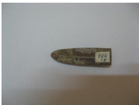
1. КП-704 1964г. Белемнит. Половинка от продольного разреза. Окаменелость. Размеры: 1,6x5,8 см.