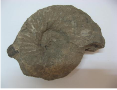
68. КП-9392 2010 г. Аммонит. Мезозойская эра, юра - мел. Дар. Размеры: 14,5x1,0 см.