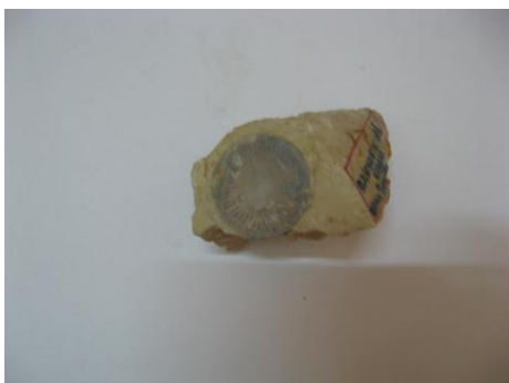
39. КП-6951/6 Фрагмент шестилучевого коралла в известняке. Около 200 млн.л.н. Дар. Размеры: