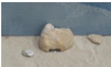
22. КП- 4832 Окаменевшая раковина моллюска Amphidonta conica Sow. Определена кафедрой геологии Саратовского университета в 1978 г. Верхний карбон. Дар. Размеры: 6х4,5 см