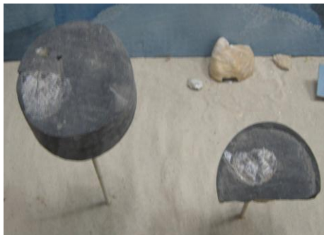
43. КП-6974/3 Керн с отпечатком брахиоподы.