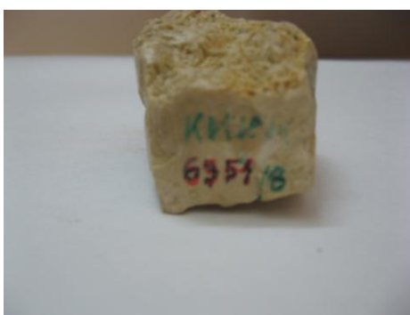
41. КП-6951/8 Фрагмент известково-скелетных остатков восьмилучевых кораллов. Около 60 млн.л.н. Дар. Размеры: 3x1,2x2 см.