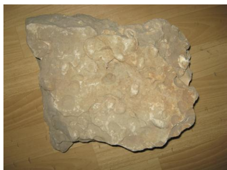
2. НВФ-1599 1972г. Пироги с окаменевшими раковинами моллюсков и отпечатками раковин. Третичный период. Найдены в 3-м овраге южнее Камышина по Волге. Размеры: