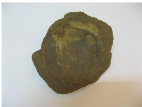
7. КП-2136/4 Камень с отпечатком раковины. Порода. Размеры: 12,5x10 см.