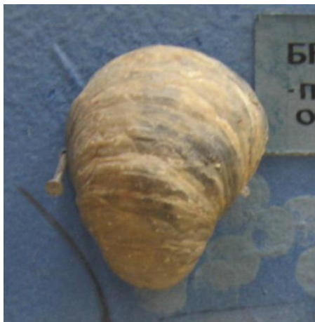
12. НВФ-5470 2010 г. Раковина моллюска брахиопода или плеченогие. Около 400-300 млн.л.н. Дар. Размеры: 6x5x3.5 см.