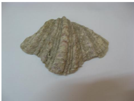
10. КП-2773 1969г. Морская раковина. Найдена в Камышине в районе улицы Лазарева. Размеры: 19x12 см.