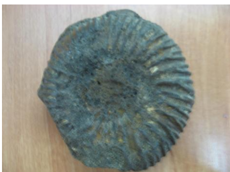
20. КП-4829 Аммонит. Определен Московским палеонтологическим музеем в 1978 г. Мезозой, юрский период. Дар. Размеры: диаметр 9 см.