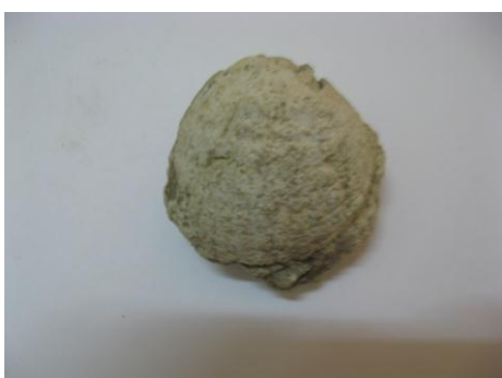
21. КП-4831 1979г. Окаменевшая раковина двустворчатого моллюска Venericardia Vjlgensis . Палеоцен. Сцементирован галечником. Палеоцен. Дар. Размеры: 7х7 см.