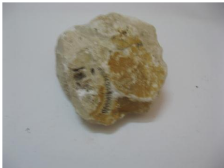
38. КП-6951/5 Известняк с включениями скелетов губок и кораллов. Известняк. Около 200-150 млн.л.н. Дар. Размеры: 7x8 см.