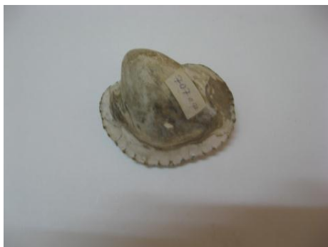
3. КП-707 1964г. Ракушка окаменевшая белого цвета. Размеры: 6x3,7 см.