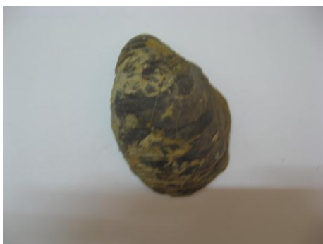
45. КП-6986/1 1993г. 1). Раковина двустворчатого моллюска. Известняк. Около 150- 100 млн.л.н. Дар. Размеры: 8x6 см.