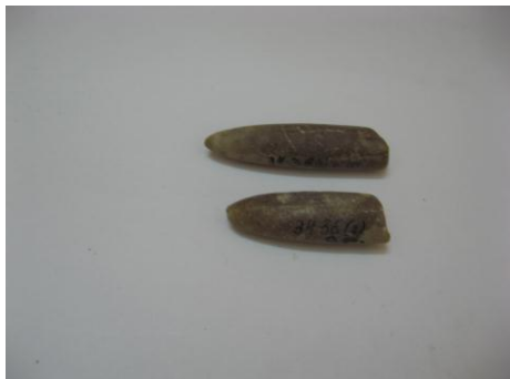
11. КП-3436/1,2 1971г. Белемнит. Дар. Размеры: 6,7; 5,3см.