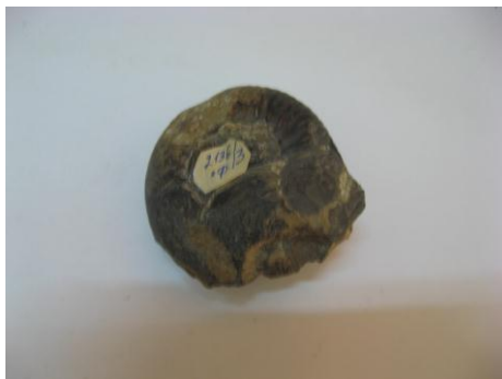
6. КП-2136/3 Окаменевшая часть морской раковины. Порода. Размеры: 9x5 см.