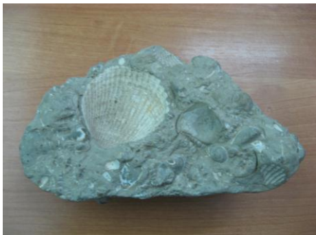
15. НВФ-5484 2012 г. Ядро створки двустворчатого моллюска в породе. Около 70 млн. л.н. Дар. Размеры: 12x19x5 см. 6.5x6.5 см.