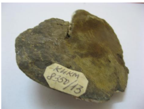
61. КП-8350/13 Ядро раковины двустворчатого моллюска Кардиты волжской. Размеры: 7,8x6,3x2,9