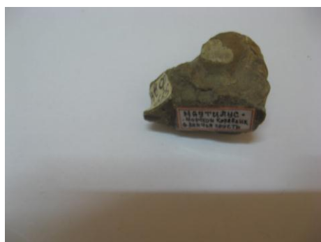
3. НВФ-4655 2002г. Раковина окаменевшего моллюска. Песчаник. Около 65 млн.л.н. Дар. Размеры: 3x3x2 см.