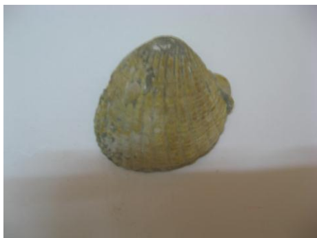
59. КП – 8208/9 Створка окаменевшая раковины двустворчатого моллюска Кардита волжская. Около 70-60 млн.л.н. Дар. Размеры: 7x6,6см.