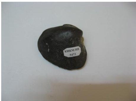
14. НВФ-5473 2011 г. Кардита. Около 70 млн.л.н. Дар. Размеры: 7x6x2,5 см.