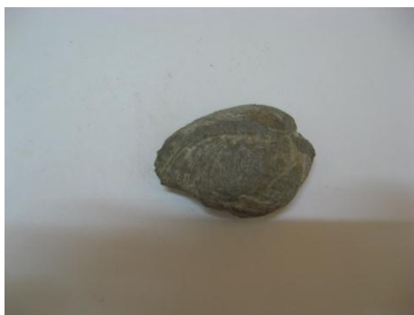
46. КП-6986/2 Отпечаток раковины двустворчатого моллюска. Опока. Около 150 млн.л. Размеры:5x4,5