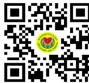
Канал МБУК КИКМ в Мах