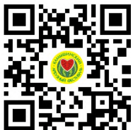
Группа фестиваля в ВК

https://max.ru/id3436106730_gos - официальный канал МБУК КИКМ в МАХ.