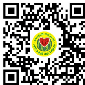
Форма регистрации ДПИ