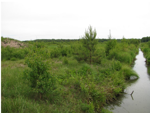
«Бачумовский торфяник. Канал»

Запасы торфа под д. Бачумово составляют около 2,5 млн. тонн. Глубина залежи торфа от 4-х до 7-ми метров. С 1993 г. разработка принадлежит Дзякинскому торфопредприятию. Был вырублен лес с 83 гектаров. Кроме того, дзякинцы то ли по незнанию, то ли от небрежности пошли рубить дальше, к Дикому озеру, прихватив 4,5 гектара охранной зоны. Правда, они посадили на этой вырубке саженцы сосен, но сколько нужно десятилетий, чтобы снова появился лес. А в этих местах находится целый комплекс лесных озер: Чуринское, Дикое, Курья, Костромское».