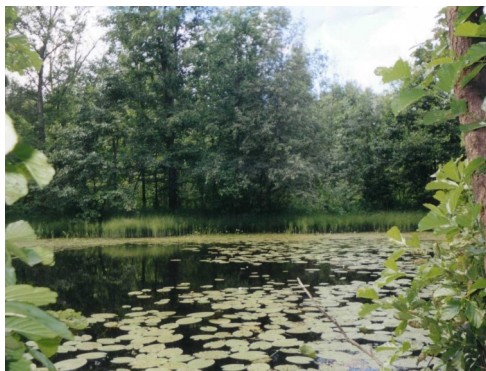
«Лыжное озеро»