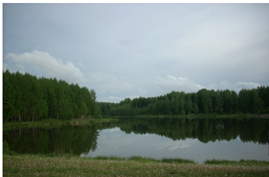
«Ярский пруд»

Так в 1983 г. был заказан проект строительства ороситель-