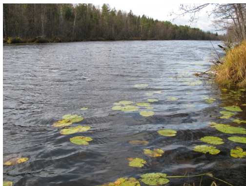
«Просторы Дикого озера».