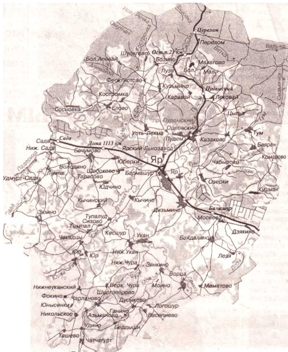
Водные ресурсы . - Яр.: Центральная библиотека, 2010. - 33 с.- (Ярский район—интересные факты).