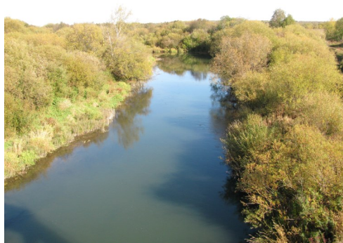
«Густые ивы над Лекмой»