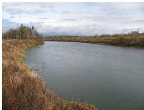
«Пространство Чепцы»