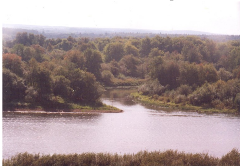
«Лекма впадает в Чепцу»