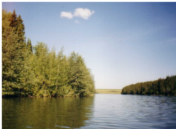
«Никольский пруд»

прибрежным растениям, кустарникам, тогда увидишь, что их здесь много. Пруд используется для водопоя скота, рыболовства, отдыха.