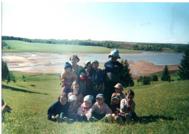
«Бозинский пруд. 2010 г.»

находился Бозинский пруд, который был искусственно построен в конце 1970-х годов. Это было самое распространённое место отдыха не только для местных жителей, но и для отдыхающих со всей Удмуртии и других регионов. В 2001 году случилась экологическая катастрофа – прорвало плотину, и пруд весь ушел. Погибло много рыбы, не стало среды обитания для многих перелетных птиц, улетели с пруда белые лебеди. Для ремонта дамбы в районе нет средств,