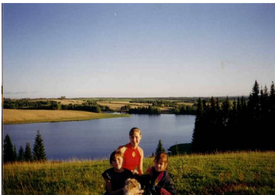
«Бозинский пруд. 1980 г.»

Деревня Бозино стоит на горе Астраханка. С нее открываются замечательные по красоте пейзажи: леса и перелески чередуются с полями на холмах и небольшими деревеньками. В хорошую погоду с горы виден купол Еловского Свято – Троицкого храма. Под горою – голубая лента небольшой речушки Сизьма, которая несет свои воды в р. Чепца. Совсем недавно здесь