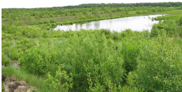
«Бачумовский торфяник. Залив»

Бачумовское торфяное болото находится на левобережье долины реки Чепцы. Площадь болота 930 га. Считается памятником природы местного значения по постановлению от 9 июля 1997 года.