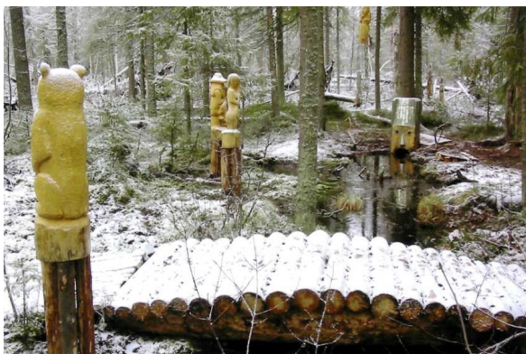
«Мир древнего деревянного зодчества на истоке Вятки»

Река Вятка уже с древнейших времён была заселена финно-угорскими племенами. Волго-Уральский регион, включая бассейн реки Вятки, является прародиной финно-угров; именно в бассейнах Камы и Вятки происходило формирование родоплеменных групп удмуртов.