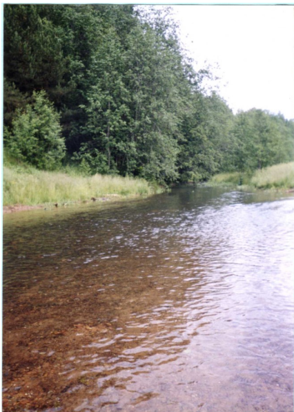
«Река Сада»

(В. Потемкин. Сельская правда - 2010. - 20 июля. Энциклопедия УР)