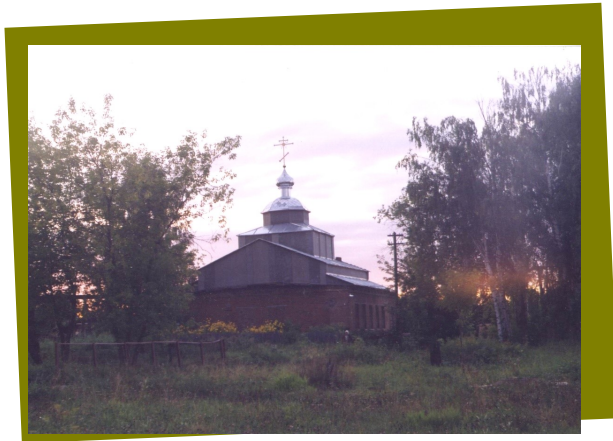
Действующая Свято - Николаевская церковь п. Яр.

Николаевская церковь закрыта в 1931 г. По воспоминаниям старожилов здание церкви сгорело в 1939-1940 гг.