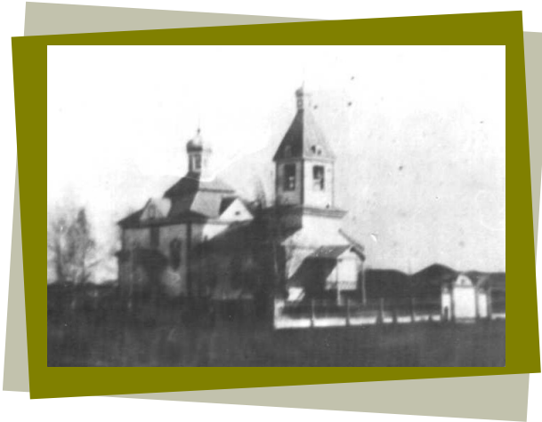
Сретенская церковь (1861 – 1938 г.г.)