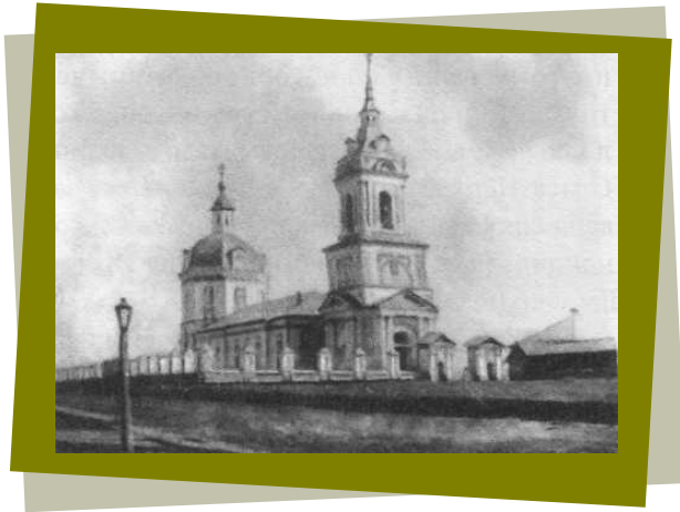
Спасская церковь (1811 – 1932 г.г.)