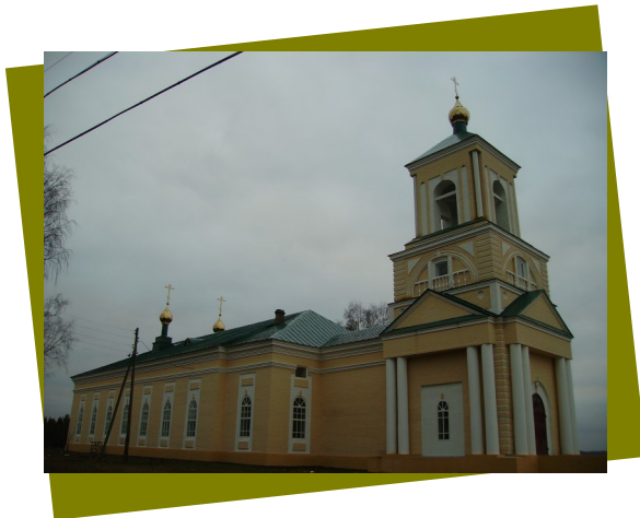
В 2009 году Спасская церковь была восстановлена