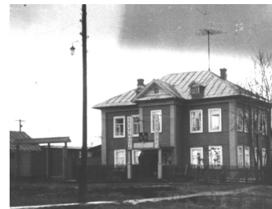
Старое здание почты

В первые годы образования района в штате почтовой конторы числились 32 пеших письмоносца (так тогда называли почтальонов), 3 конных и ещё 8 почтовозов по участкам. С 1935 г. отдел связи стал называться конторой, а затем - узлом. Один из первых начальников - В.Н. Бушманов. Появилось здание конторы, обменного пункта. В настоящее время в коллективе почты Ярского отделения трудится 14 человек. Ежедневно три оператора ведут приём платежей за коммунальные услуги и за сотовую связь, приём посылок, ценных бандеролей, переводов, производят выплату пенсий. Всё большим спросом пользуется электронная почта. В любое время посетители могут зайти в Интернет.