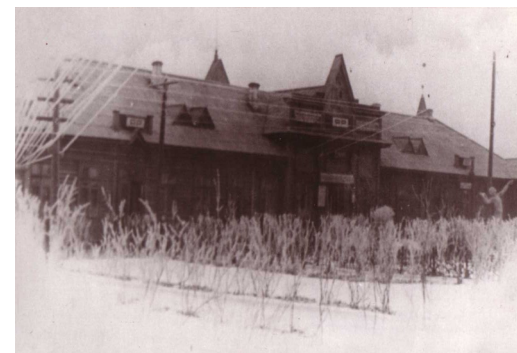
Старое здание вокзала