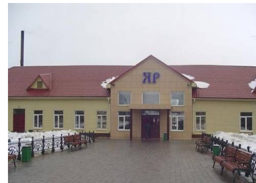
Современное здание вокзала

Здание старого вокзала было построено в 1894г. Первое здание вокзала и сейчас стоит на перроне, где размещается магазин. Вокзальное помещение было барачного типа, где были билетная касса, зал ожидания, милиция и другие служебные помещения.