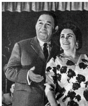
Отец и дочь

Оркестр Утесова стал своеобразной творческой лабораторией песни. Постепенно расширяется круг авторов, которые писали для оркестра музыку. Среди них были Н. Богословский, Д. Покрасс, В. Соловьев-Седой. Они специально создавали для утесовского оркестра героические, драматические, лирические, шуточные песни. Репертуар оркестра был тогда, пожалуй, одним из самых интересных и разнообразных среди всех джазовых ансамблей. Эта напряженная работа не прекращалась даже во время Великой Отечественной войны. Утесов постоянно выезжал на различные фронты. 9 мая 1945 года он играл перед москвичами на площади Свердлова.