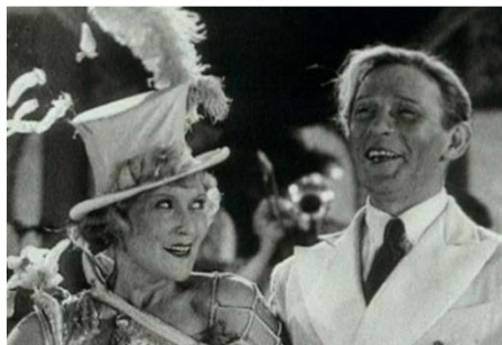
В фильме «Веселые ребята»

В 1929 году Утесов организовал и возглавил первый в СССР театрализованный джаз – «Теаджаз». Почти пятьдесят лет он оставался руководителем этого коллектива и объездил с ним всю страну. Утесовский оркестр везде встречали и провожали овациями, он завоевал необыкновенную популярность.