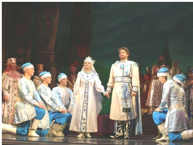
Сцена из оперы М.И. Глинки «Руслан и Людмила»

Когда Глинка приезжал в Новоспаское, родители, зная его давнюю страстную любовь к русским народным песням, приглашали в дом крестьян, устраивали для них угощение, и долго не умокали в доме песни. Эти Новоспаские музыкальные вечера были для Глинки едва ли не радостнее петербургских.