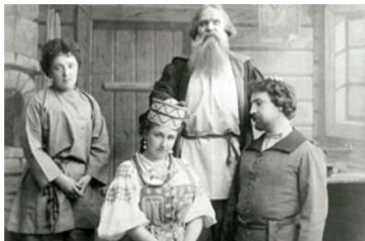
Сцена из оперы М.И. Глинки «Жизнь за царя»