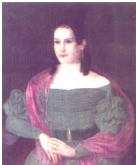
Екатерина Ермолаевна Керн

Глинка полюбил эту девушку, и эта любовь стала для него источником радости и вдохновения. Но она принесла немало горьких переживаний: теперь он чувствовал, какой ошибкой была его женитьба.