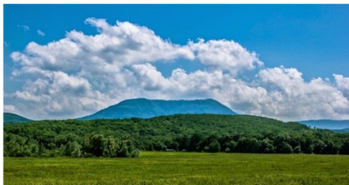
Визитной карточкой Северского района считается гора Собер-Оашх (736 м).

Наш район примечателен еще и тем, что здесь достаточно мест для любительской охоты и рыбалки. По территории района протекают живописные горные реки: Шебш, Афипис, Убин, Иль. На севере район граничит также с небольшим участком главной реки Краснодарского края - Кубани. Поймы этих рек и берега прудов стали излюбленными местами отдыха не только для местных жителей, но и многочисленных гостей района.