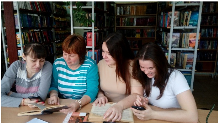
Участие в краевом кибертурнире