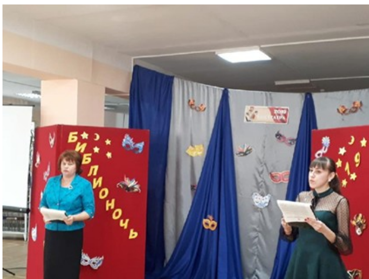
Всероссийская акция «Библионочь-2019»