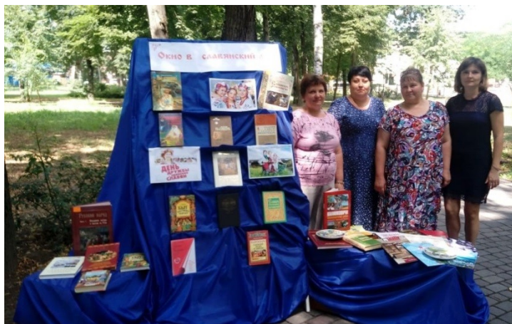
Книжная выставка к празднованию Дня дружбы и единения славян. 2019 год