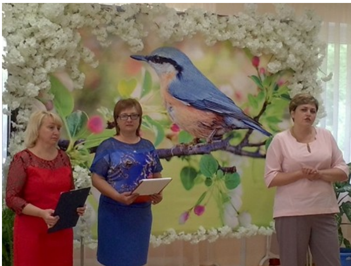
Районный профессиональный конкурс «Лучший библиотекарь Северского района» 2018 год