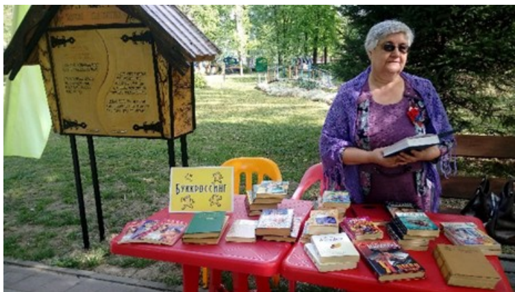
мая 2019 год буккроссинг в парке им. А.С Пушкина. «Народная библиотека»