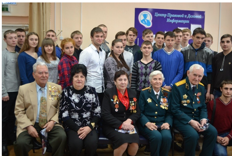
Месячник оборонно-массовой и военно-патриотической работы. 2017 год