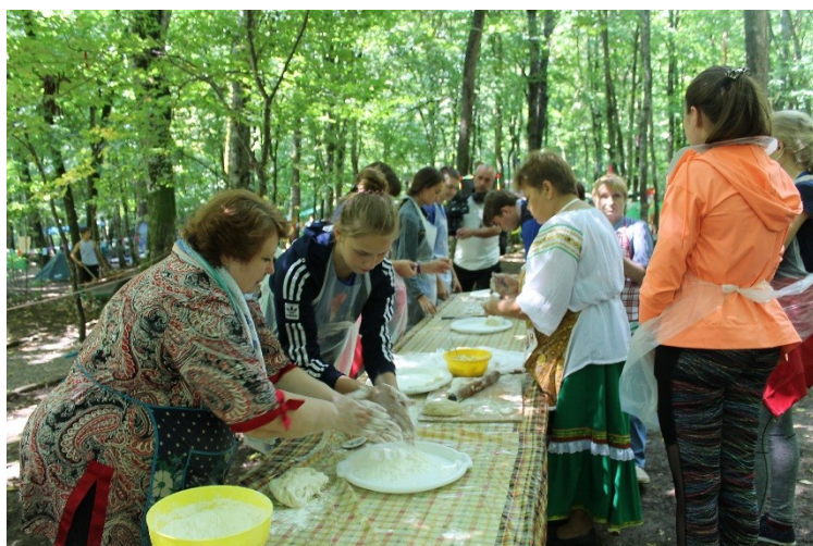
Участие в молодежном форуме «Регион-93». 2018 год