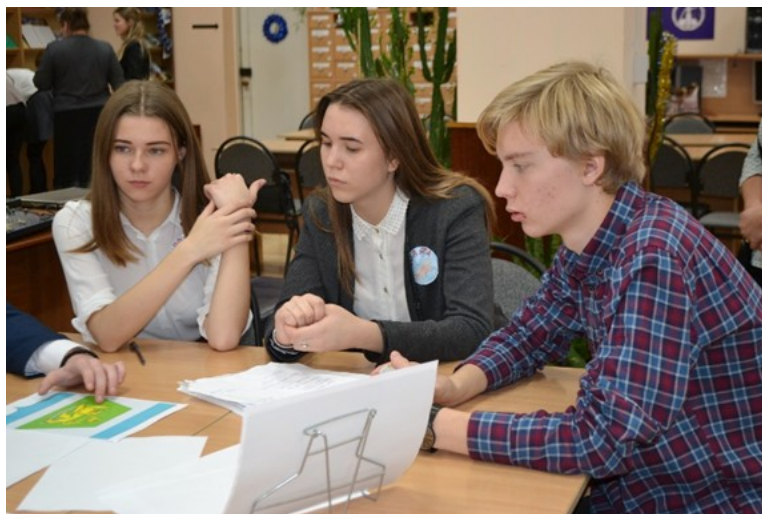
Квест-игра «Кубанский парламентаризм: история и современность». 2017 год