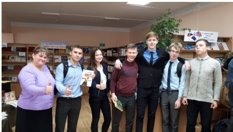
Мы за здоровый образ жизни! 2018 год.