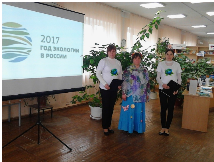
Мероприятие к Году экологии - 2017