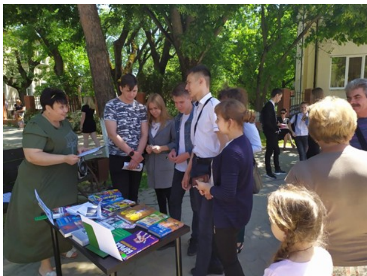
Акция по пропаганде здорового образа жизни