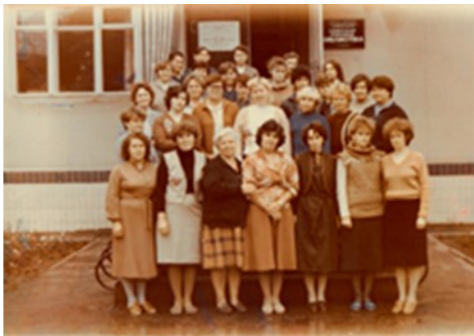
Коллектив централизованной библиотечной системы на пороге нового здания библиотеки 1987 год.