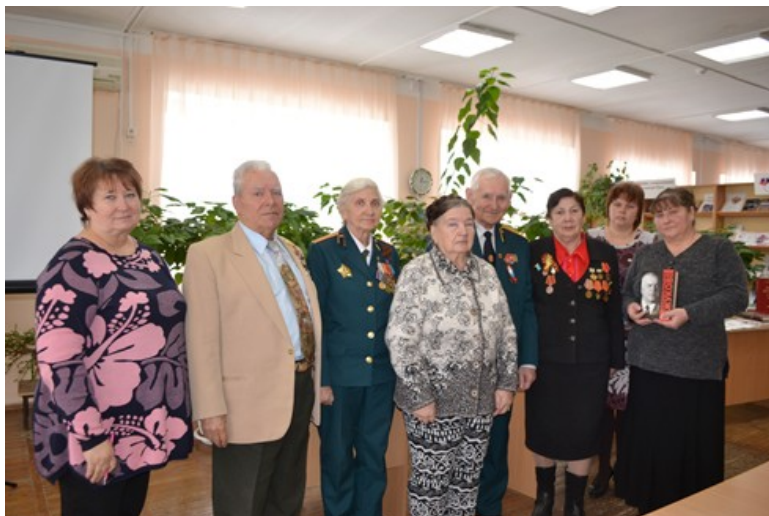
Встреча с ветеранами Великой Отечественной войны