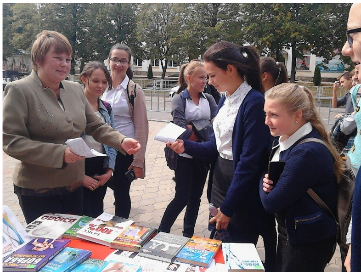
Пропаганда здорового образа жизни