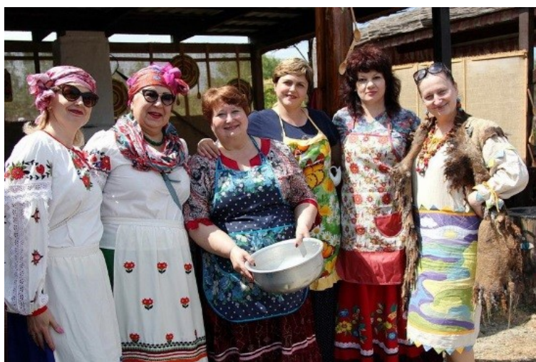
Краевой фестиваль в выставочном комплексе «Атамань». 2019 год