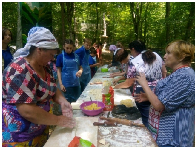
Участие в молодежном форуме «Регион-93». 2019 год