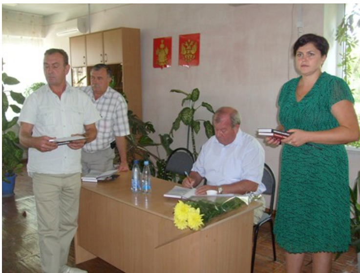
Встреча с военным и общественным деятелем Пуликовским Константином Борисовичем