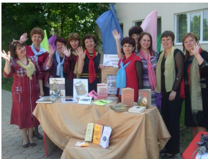
Библиотечный «Прайм-тайм» 2010 год