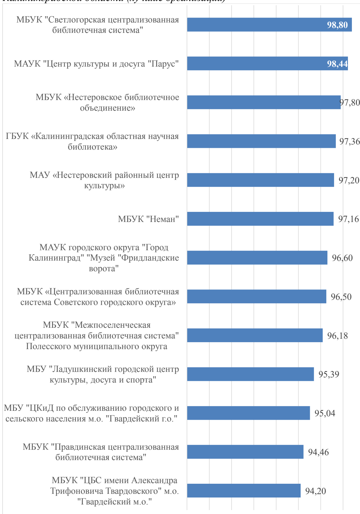
Гистограмма 1. Рейтинг по результатам сбора, обобщения и анализа информации о качестве условий оказания услуг организациями культуры Калининградской области (лучшие организации)