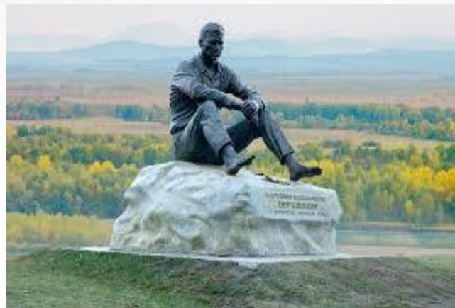
Памятник В.М. Шукшину на родине писателя (скульптор В.М. Клыков)