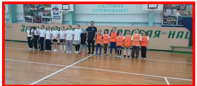
Турнир по футзалу, посвящённый Муниципальный этап Всероссийских соревнований Дню народного единства. «Кожаный мяч»