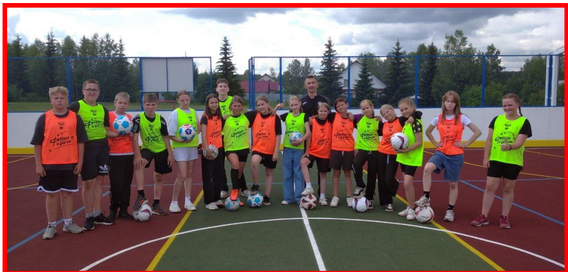
День здоровья и спорта