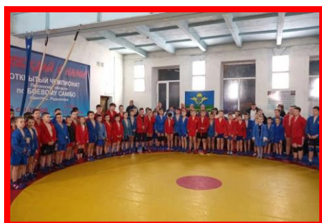
Первенство г.Кузнецка по борьбе самбо