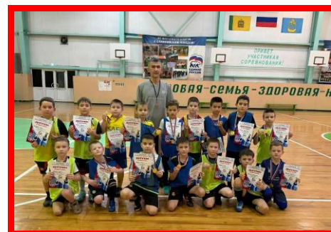
Новогодний футбольный марафон