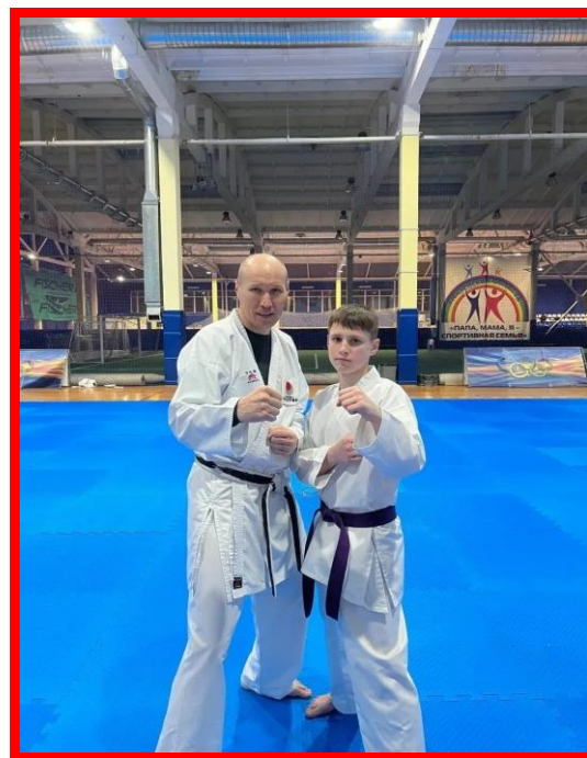
Технический семинар по сётокан-кумитэ