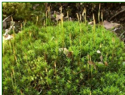
МОХ КУКУШКИН ЛЕН