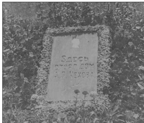
На обочине проезжей дороги — доска с надписью: «Здесь стоял дом А. П. Чехова». Фотография начала 1950-х годов