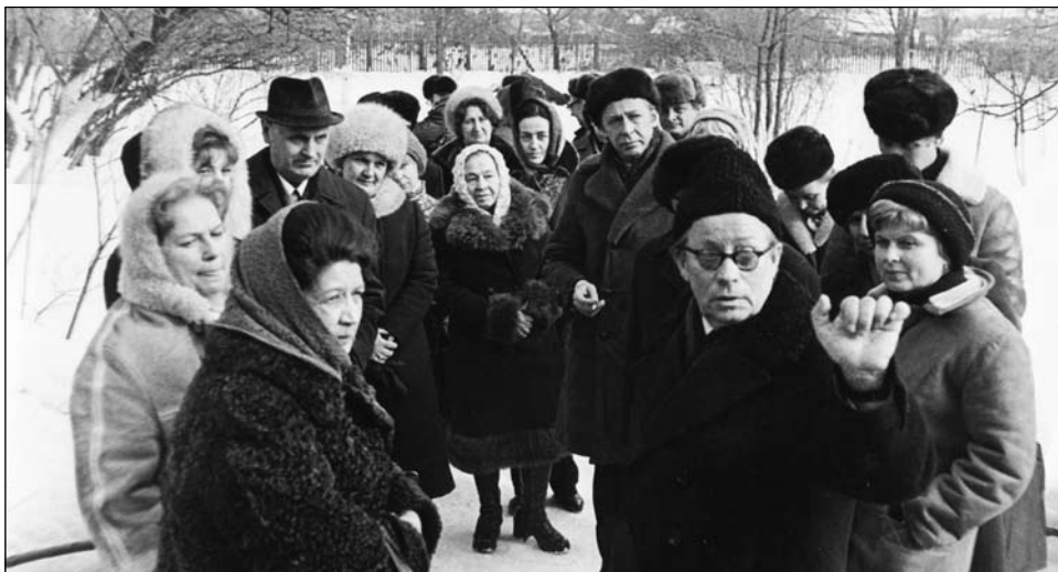
С артистами МХАТа