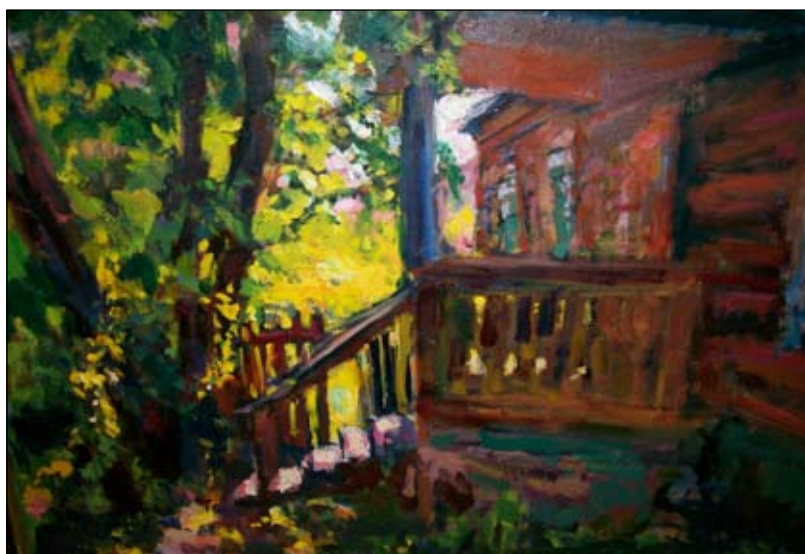
Крыльцо. 1970-е годы