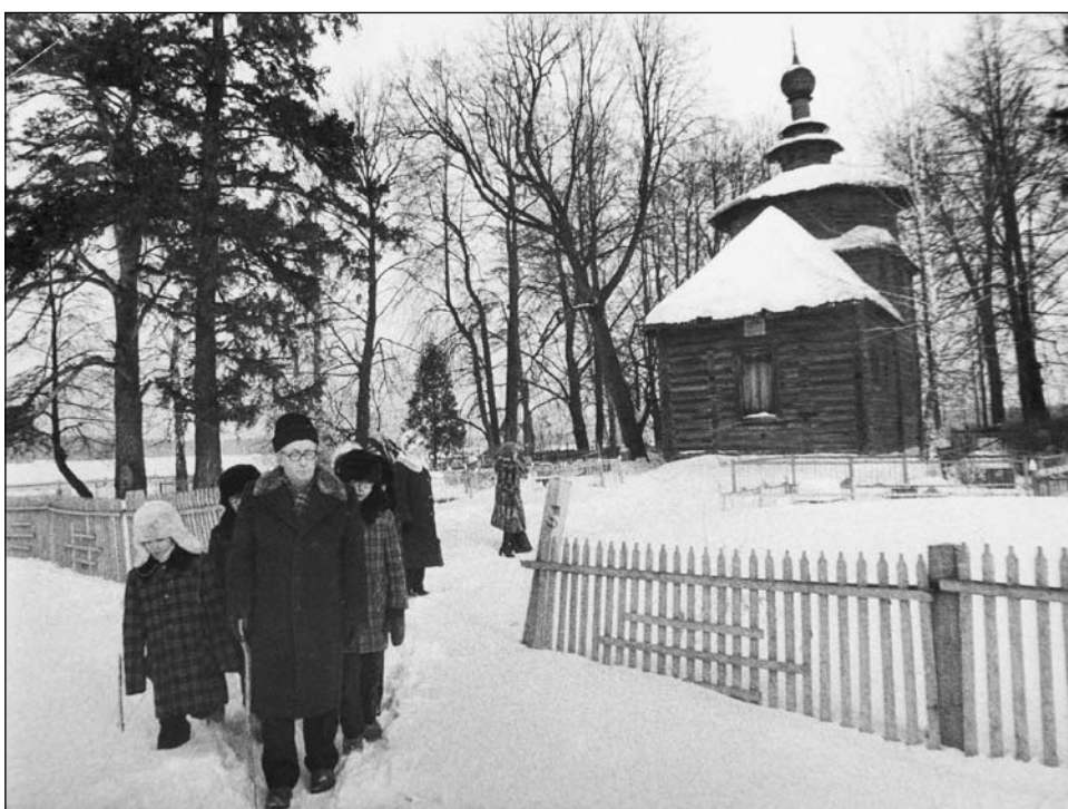
У церкви Рождества Христового со слабовидящими детьми из Тольятти