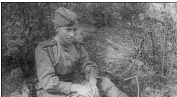
Святые Горы. Неподалеку от заминированной могилы Пушкина. Фотография 1944 года