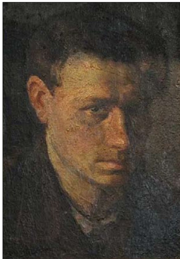
Автопортрет. 1939 год

Впрочем, воспользоваться приобретенным тогда не пришлось. Дивизию реорганизовали в кадровую и перевели на Се-