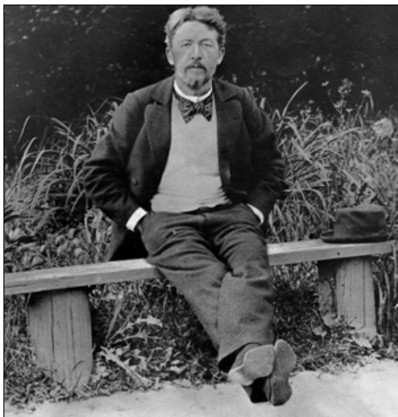
А. П. Чехов в Мелихово