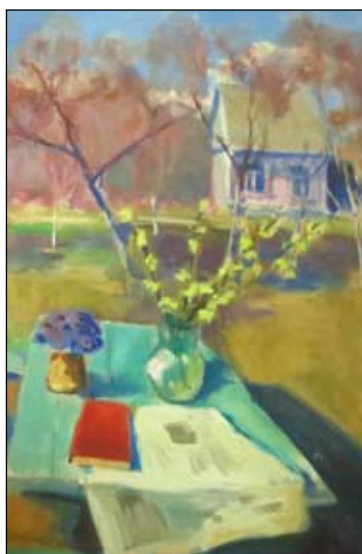
Первые цветы. 1970-е годы