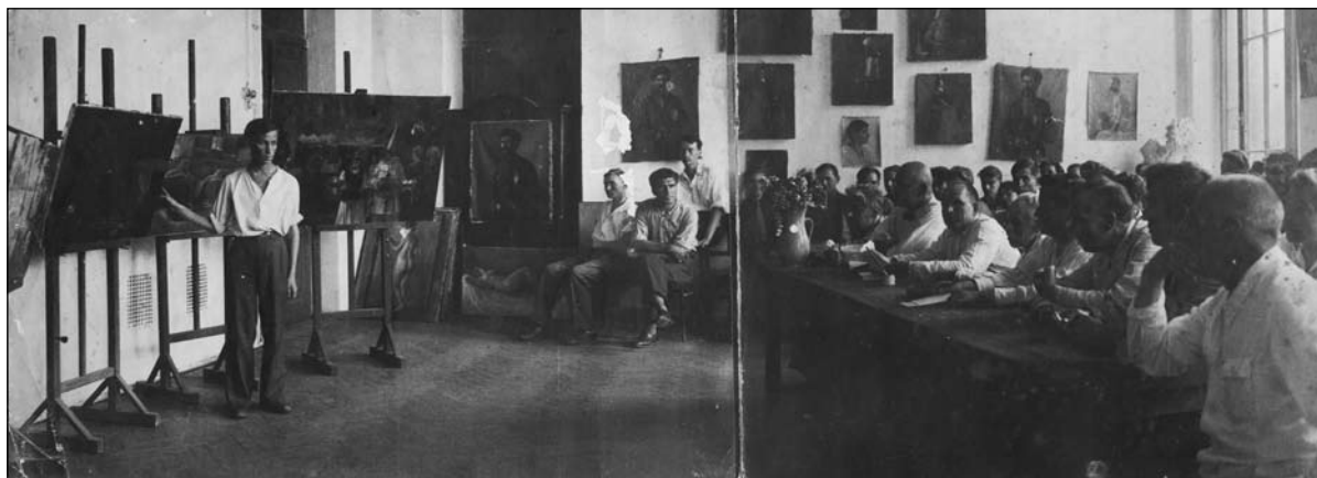
Защита диплома в художественном училище. 1940 год