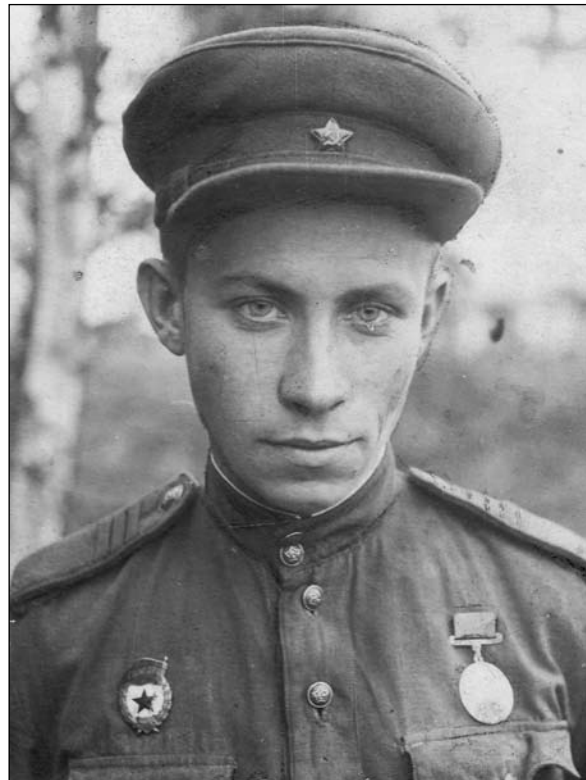
В день вручения медали «За отвагу». 1943 год