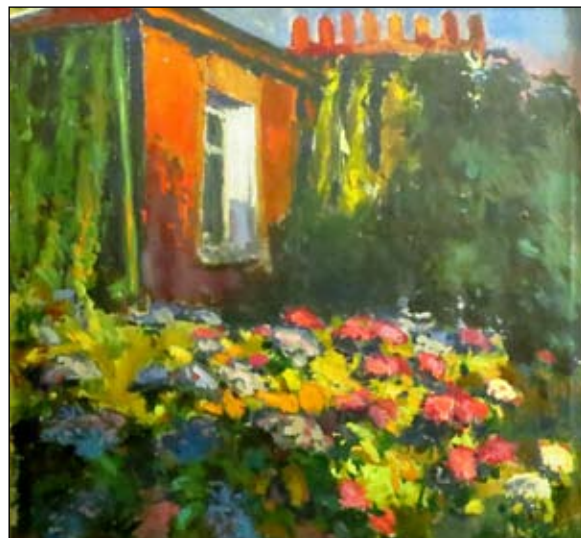
Чеховский дом. 1970-е годы