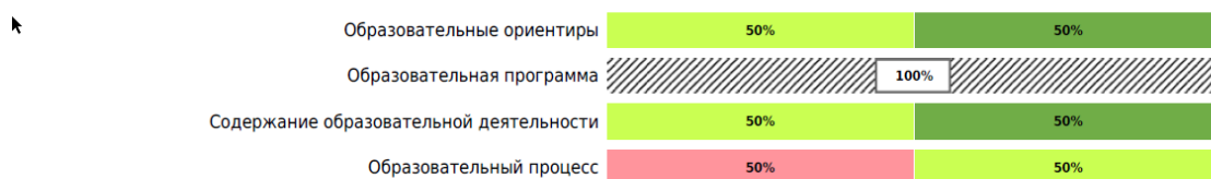
Доли ДОО с разными баллами у их ООП ДО ДОО (внешняя оценка)