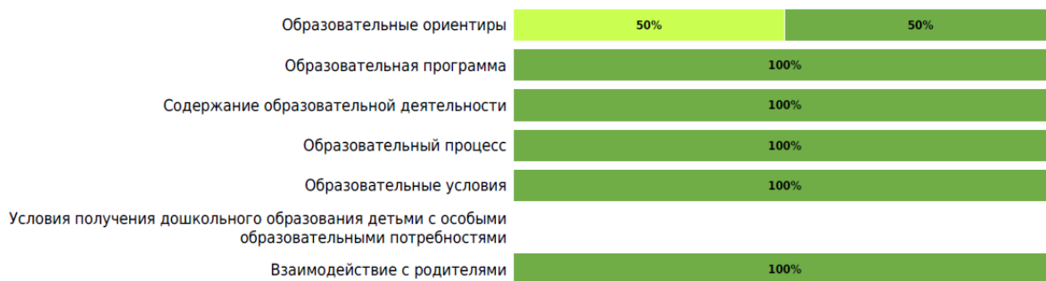
Доли ДОО с разными баллами (степень удовлетворенности родителей)

Результаты оценки качества образования в ДОО субъекта РФ с точки зрения родителей/законных представителей (степень удовлетворенности) по областям качества (по 5-балльной шкале):