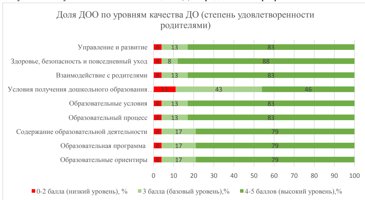
Рисунок 4. Результаты независимой оценки ДОО родителями в разрезе областей качества.

По итогам независимой оценки качества образования в ДОО степень удовлетворенности качеством образования в ДОО, принимавших участие в МКДО, позволяет осуществить кластеризацию ДОО по уровням качества предоставляемых услуг по присмотру и уходу за детьми. По мнению родителей в 77,6% образовательных организаций качество образования и предоставления услуг по присмотру и уходу достигает высокого уровня (рисунок 3, где проценты, указанные на диаграмме, означают долю дошкольных образовательных организаций, набравших определенное количество баллов, обозначенных разными цветами). ДОО нацелены на постоянное совершенствование своей образовательной деятельности, стремятся к эффективному управлению ресурсами организации, в том числе управлению знаниями как важнейшим ресурсом организации. 17,5% ДОО обеспечивают качество образования на базовом уровне , т.е. обеспечивается полное выполнение требований ФГОС ДО и других нормативно-правовых актов, регулирующих деятельность дошкольного образования РФ. В 4,9 % ДОО показатели качества со средним значением ниже 3,0 баллов, т.е. соответствуют низкому уровню предоставляемых услуг, поэтому требуется серьезная работа по повышению качества, поскольку регистрируемый уровень качества сопровождается значительными недочетами/нарушениями нормативно-правовых требований в