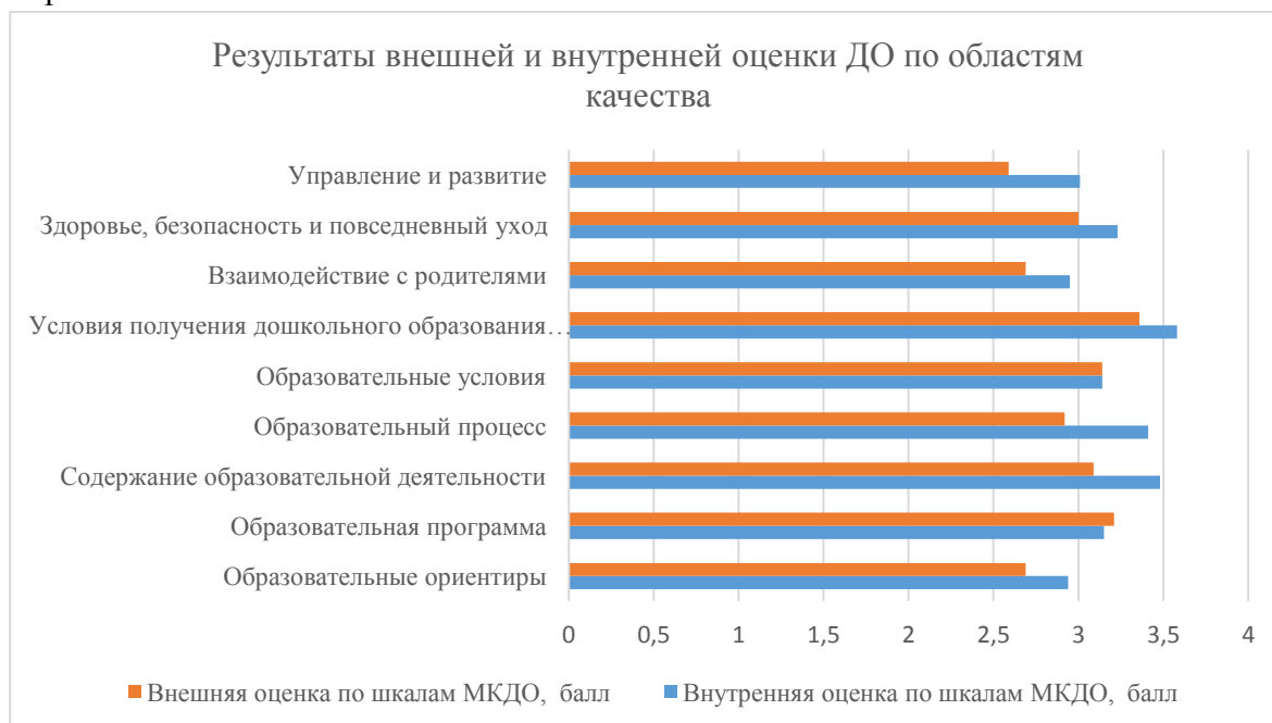
Рисунок 1. Результаты внутренней и внешней оценки качества в ДОО по областям качества образования.

Как видно из таблицы 2 по результатам среднего значения показателя базовый уровень достигнут по 6 областям качества, что свидетельствует о том, что: