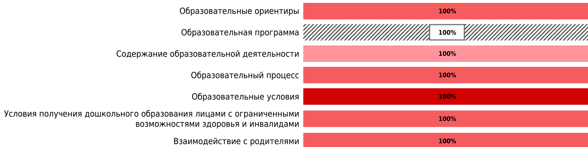
Доли ДОО с разными баллами у их ООП ДО ДОО (внешняя оценка)

В процессе внешней оценки было оценено 1 ООП ДО ДОО из 1 ДОО субъекта РФ.