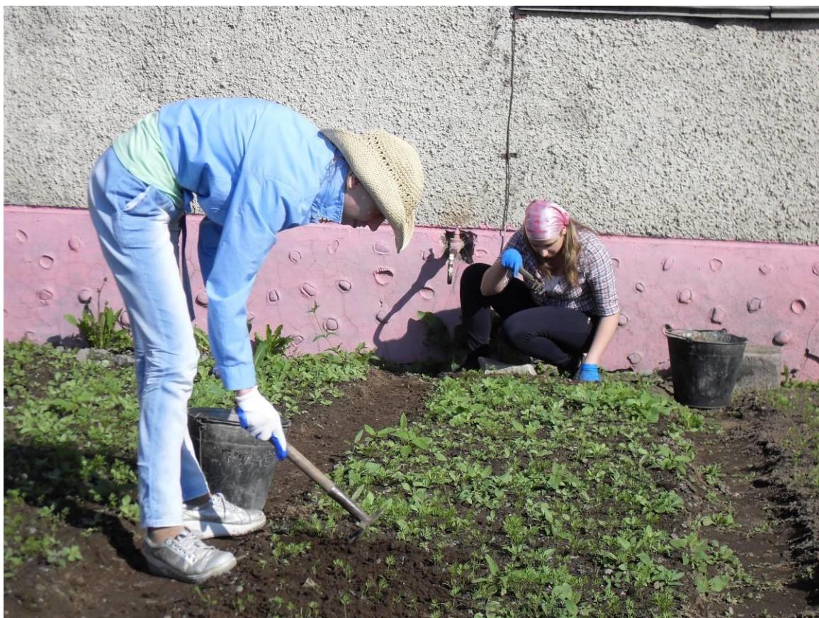
Прополка грядок зоне овощных и злаковых культур