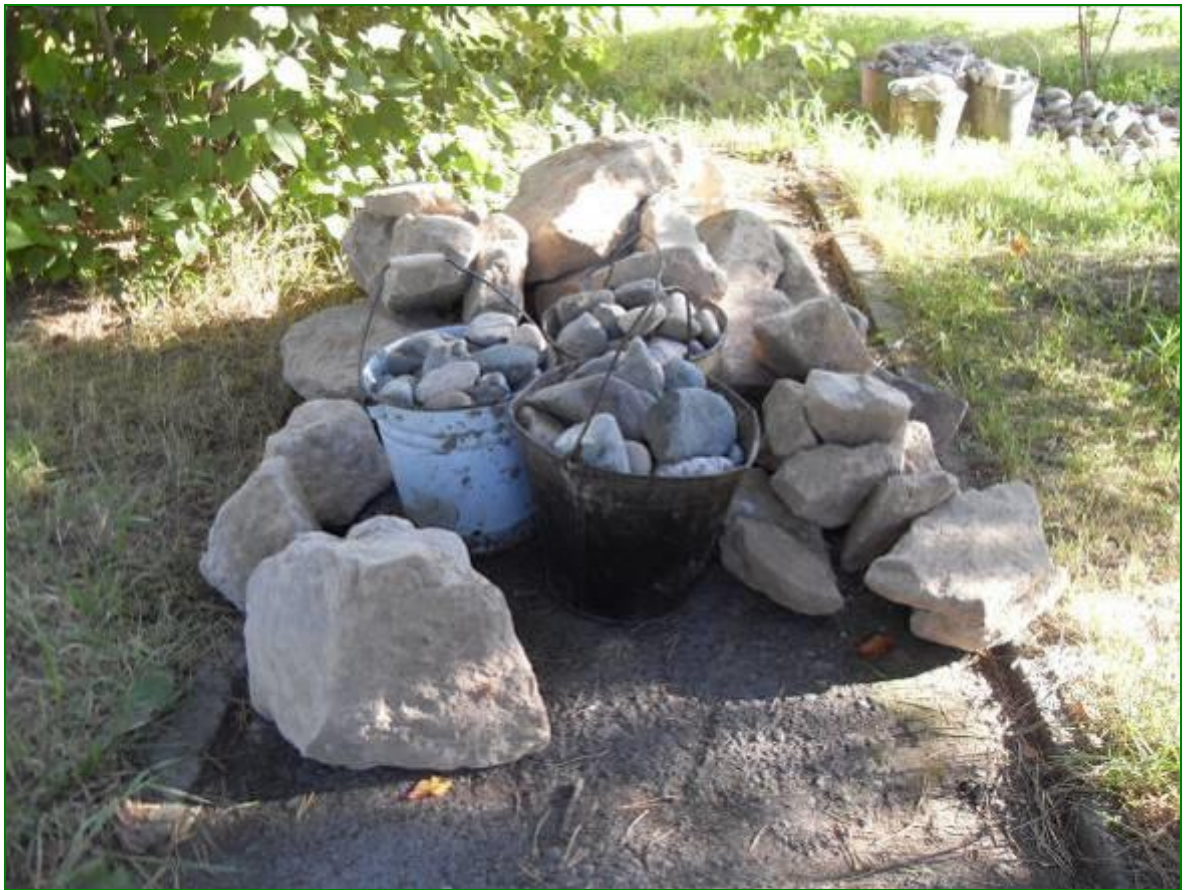
Подготовка каменного материала для будущего сухого ручья