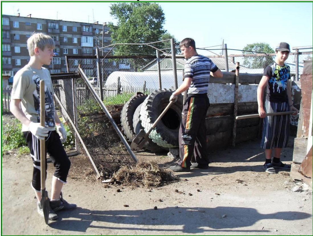
Просеивание компостной кучи