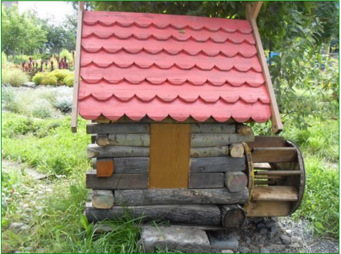
Мельница на сухом ручье