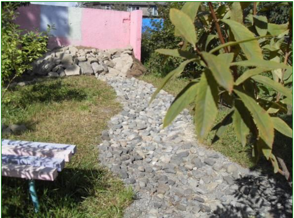
Начальная стадия по сооружению сухого ручья