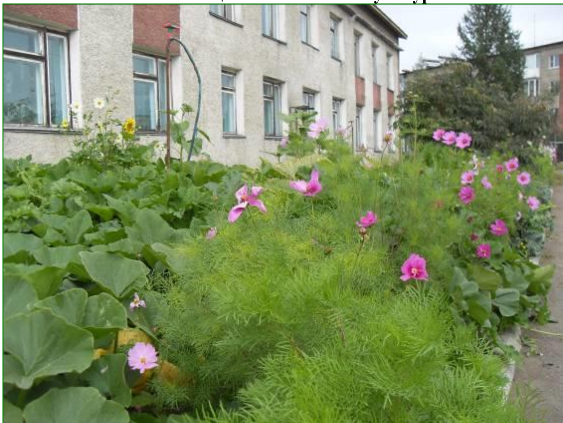
Кабачки и картофель