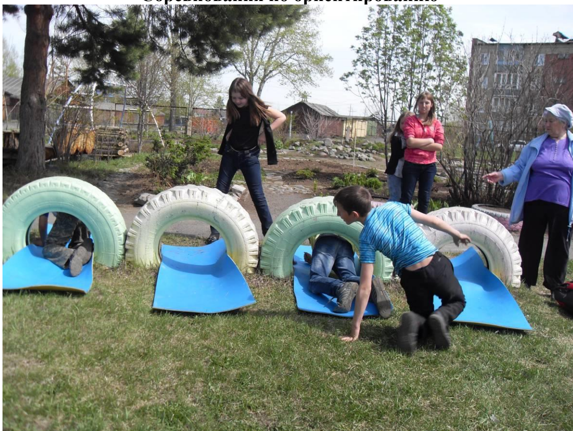
Соревнования «Лаз, перелаз»