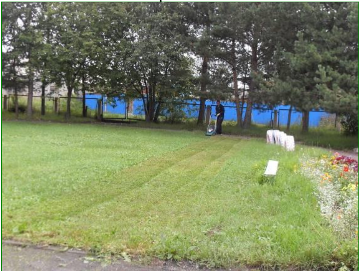
Выкос травы в игровой зоне