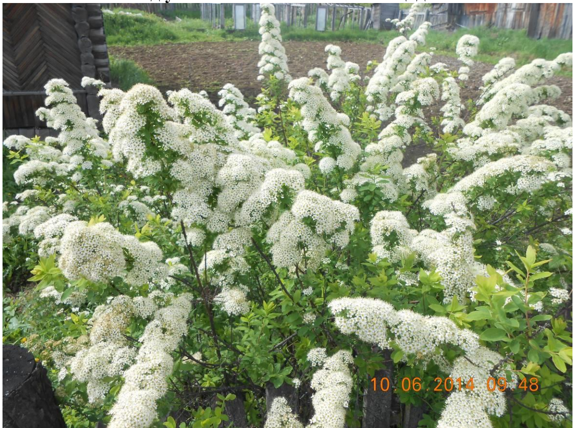
Цветет белая спирея