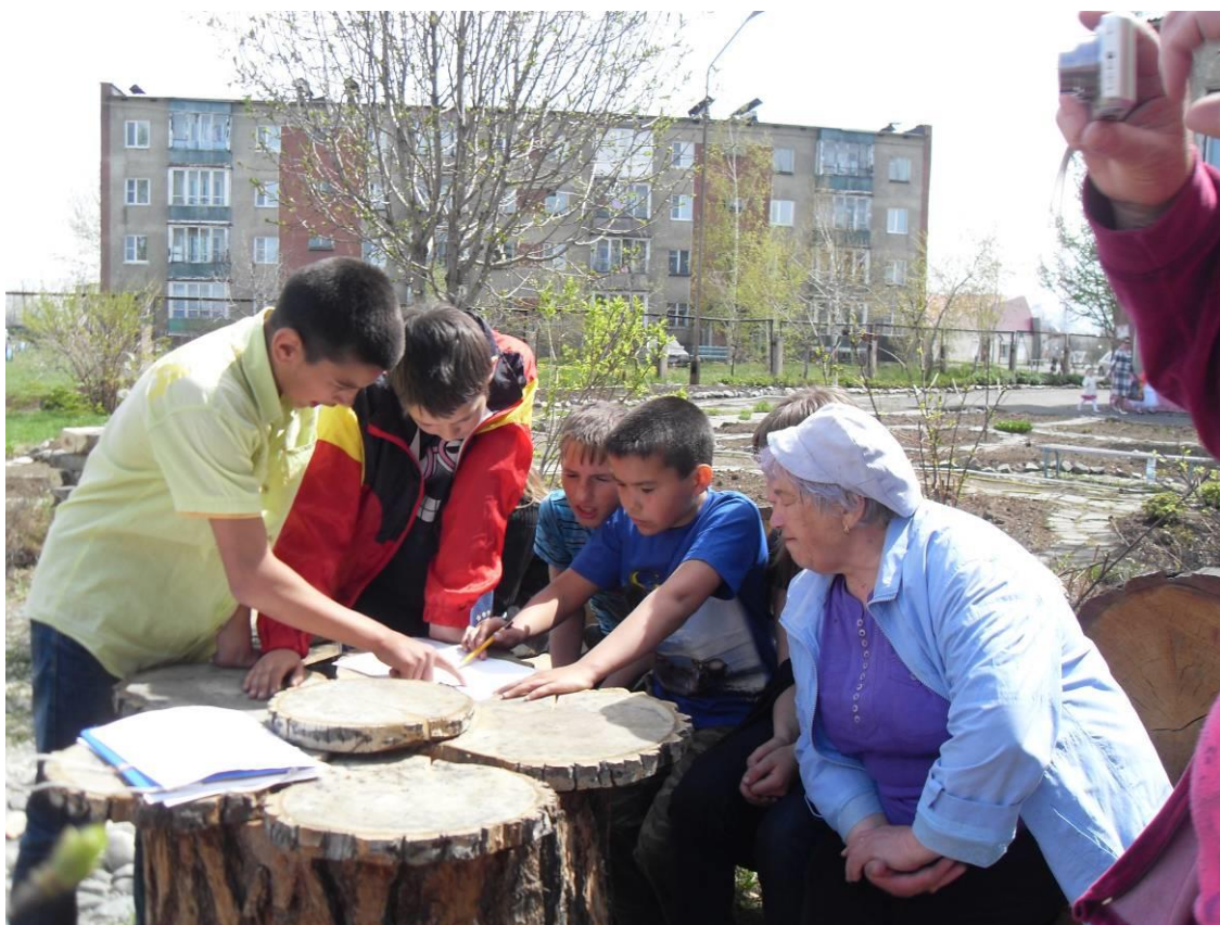
Соревнования по ориентированию