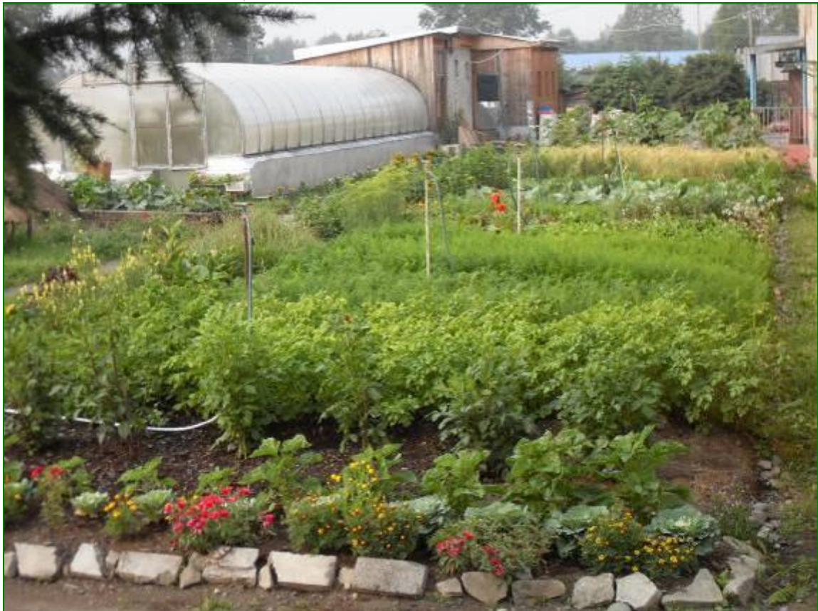
Зона овощных и злаковых культур