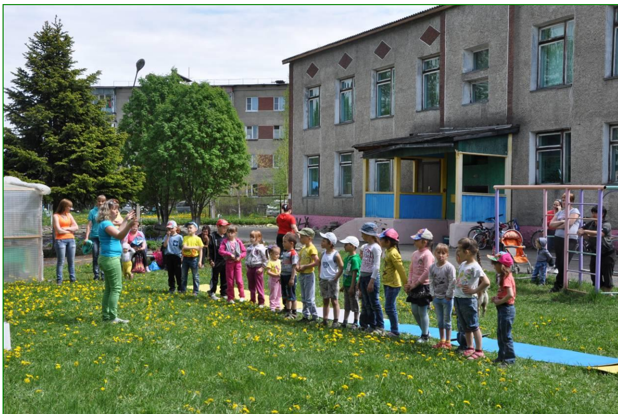
Подготовка к соревнованиям на игровой зоне