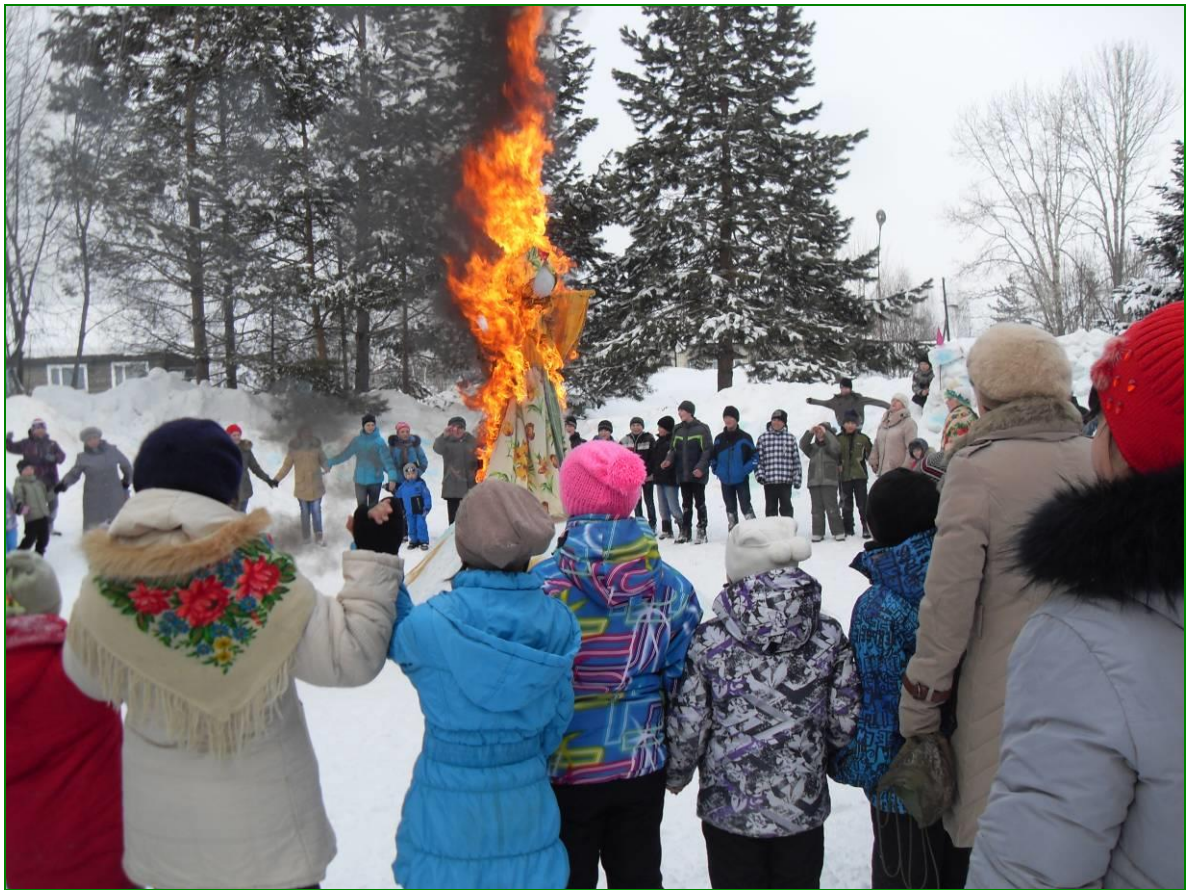
Праздник Масленица, проводимый на игровой зоне