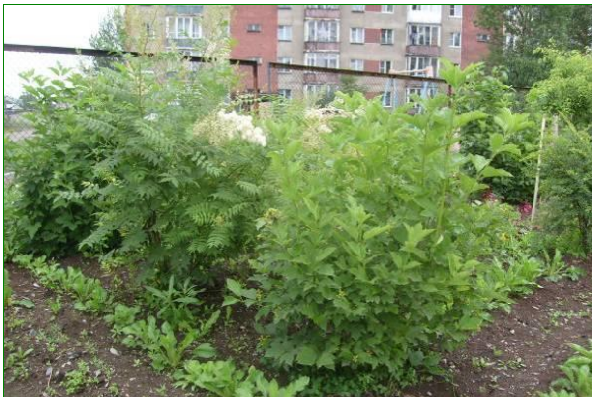
Кустарниковая растительность площадки