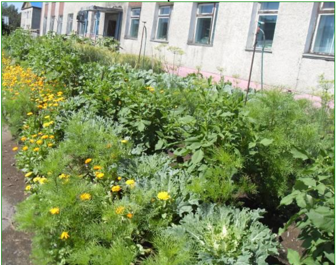
Зона овощных и злаковых культур