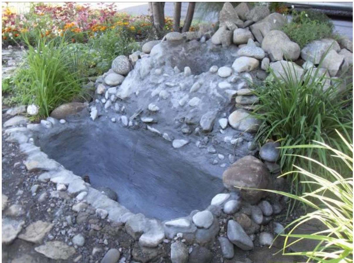
Зацементированный и выложенный галечником родничок