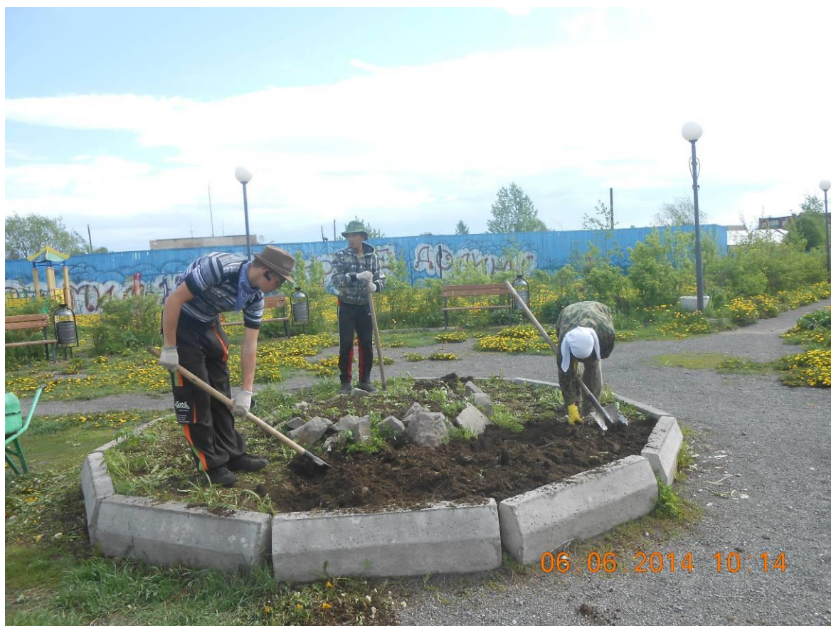
Вскапывание клумб в сквере с. Мильково