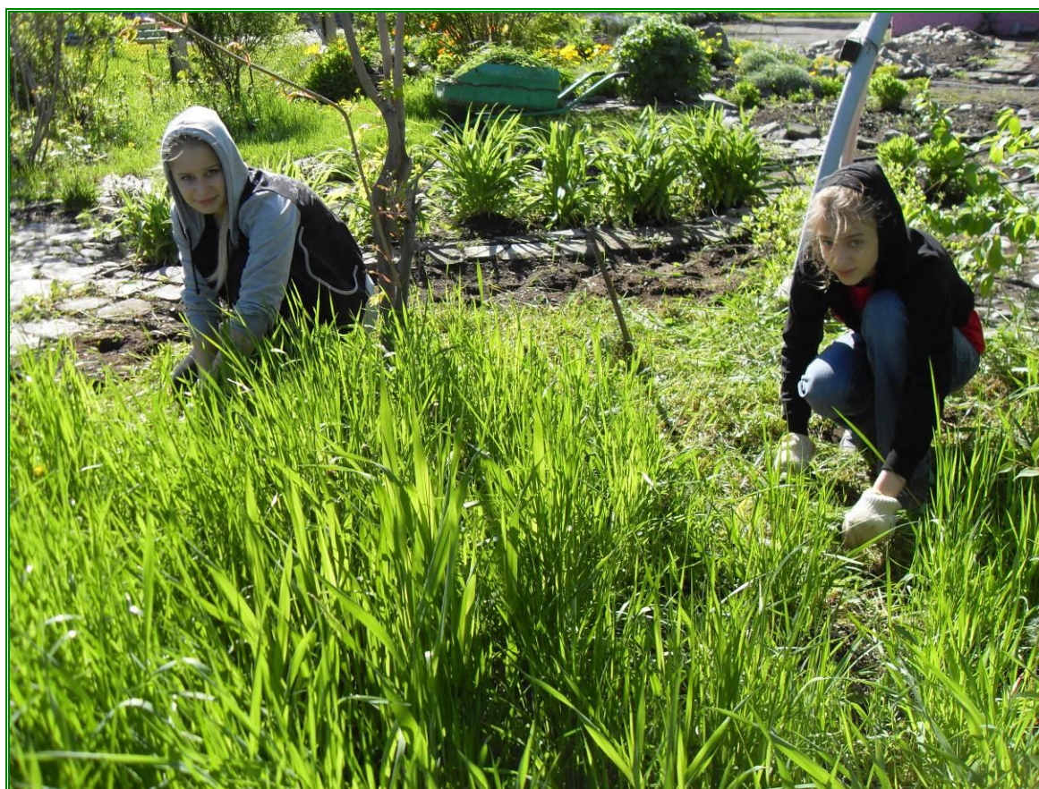
Выкашивание травы на газонах