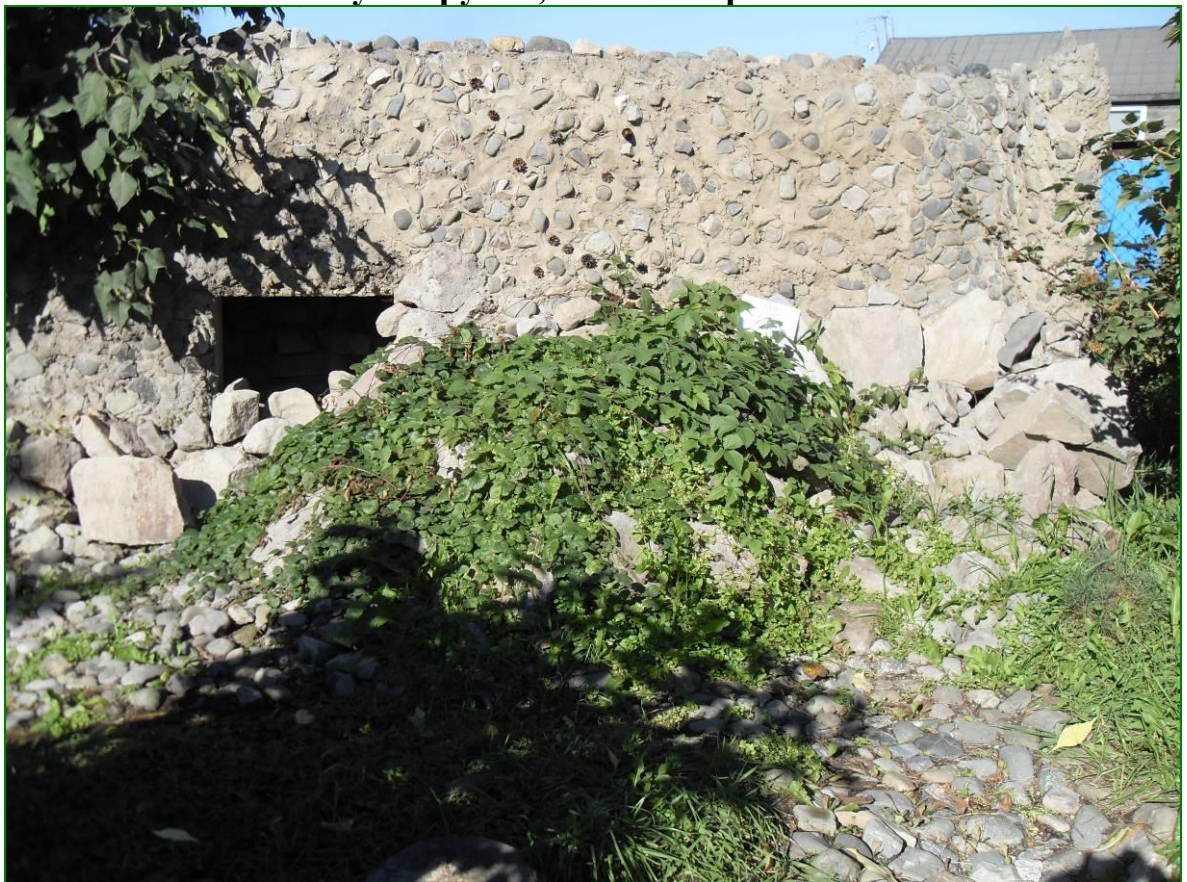
Зона сухого ручья. Грот