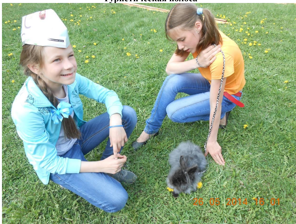
Общение с животными на игровой зоне