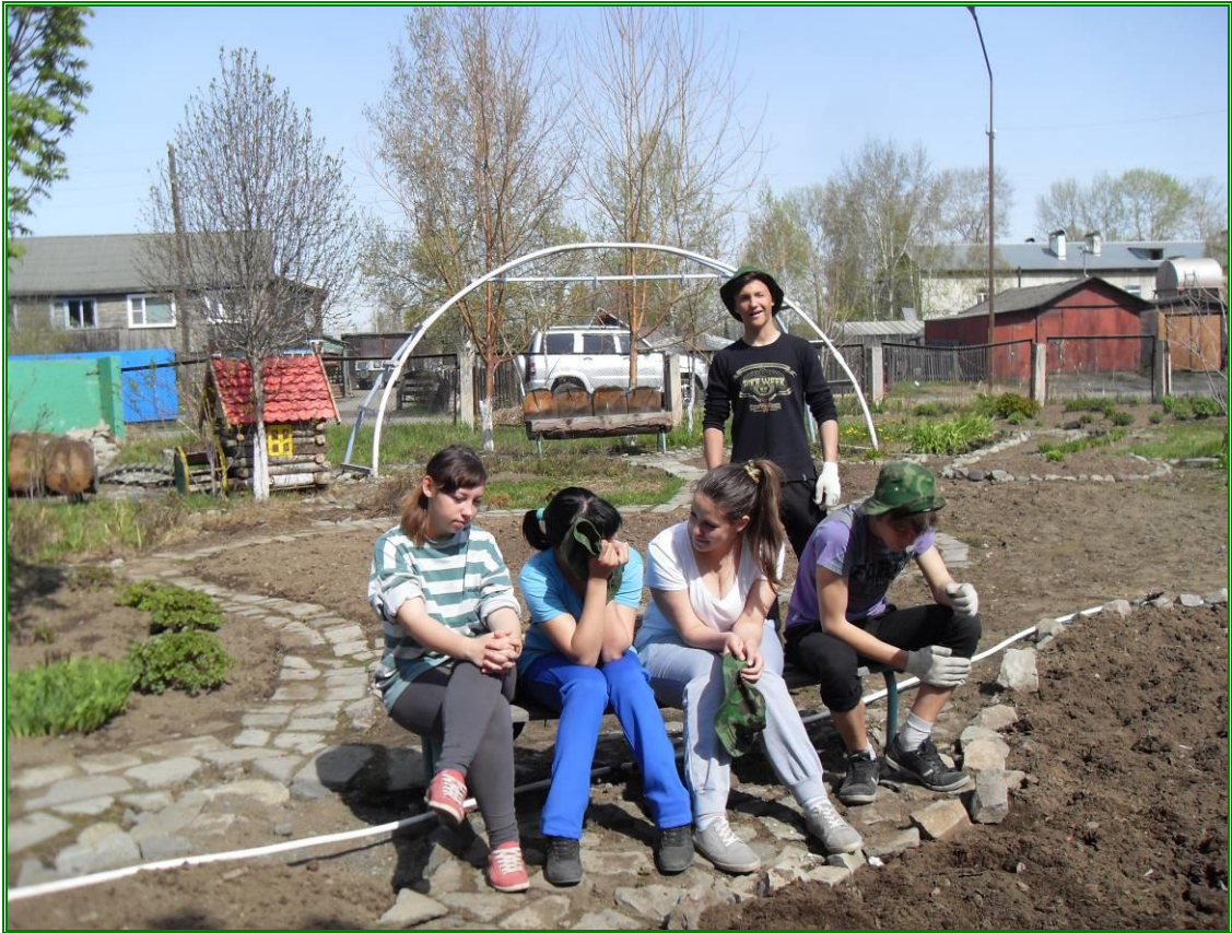
Учащиеся, работающие по проекту «В союзе с природой!», во время отдыха