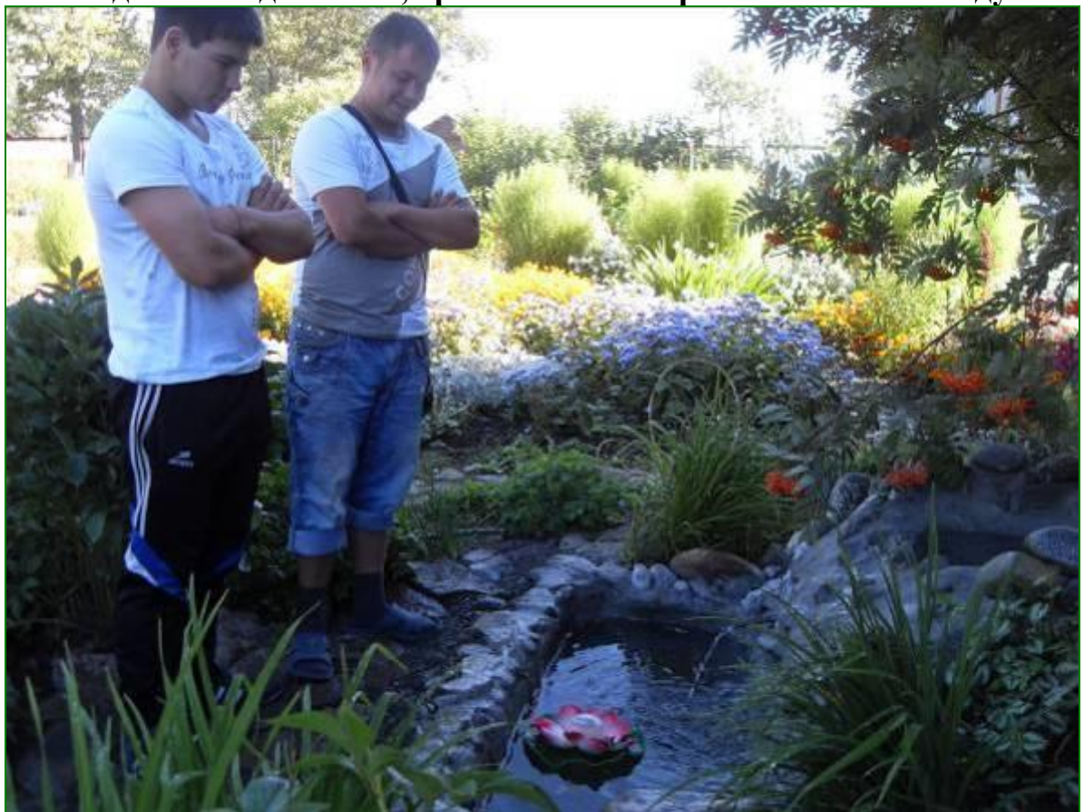
Экскурсия у родничка