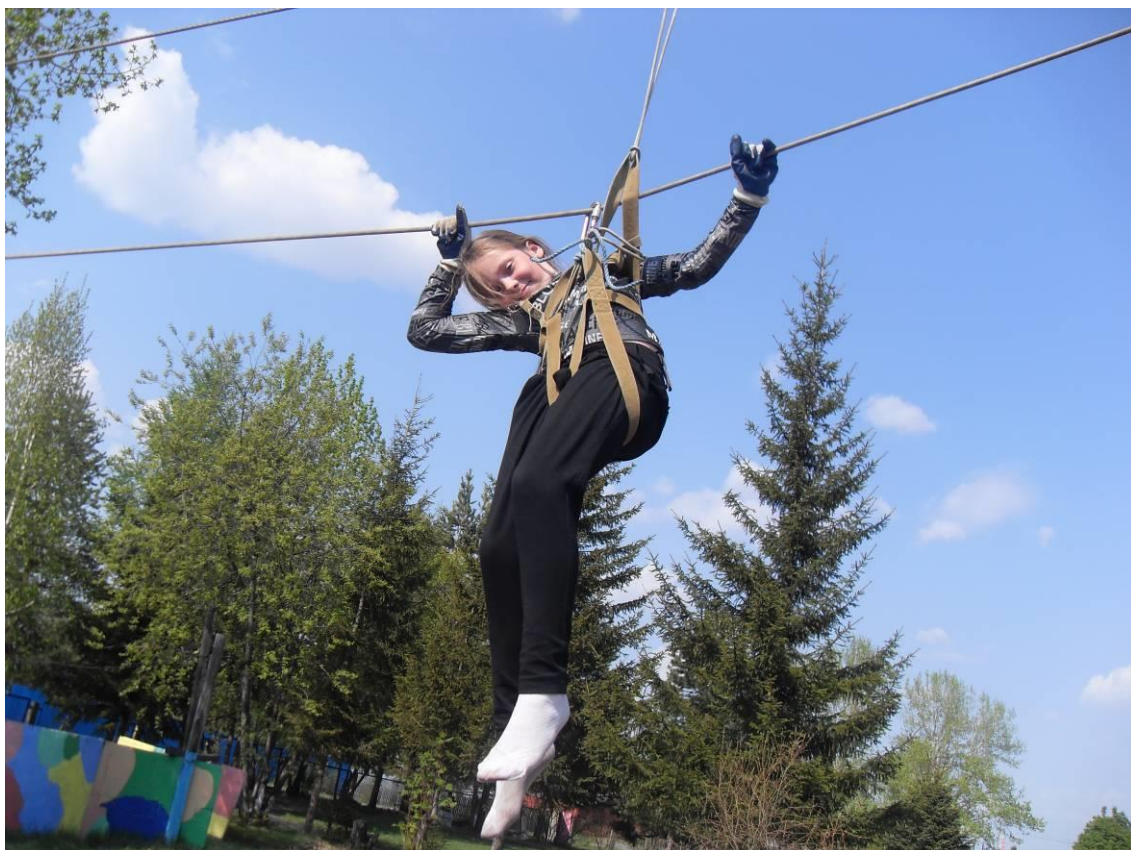
Вишу в вышине