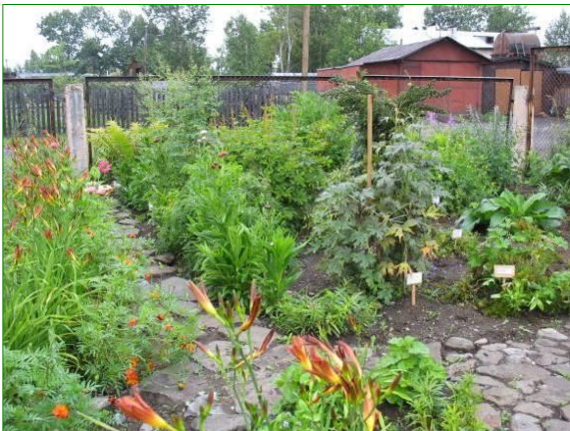
Зона дикорастущих растений