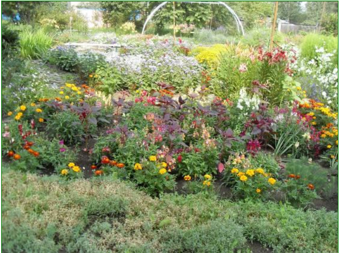
Вид учебно-экологической площадки