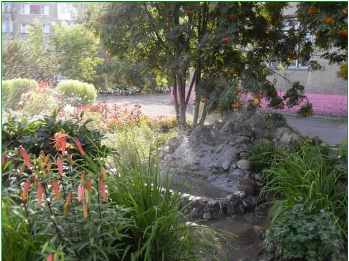
Родничок в действии, брызги в начале разлетаются повсюду