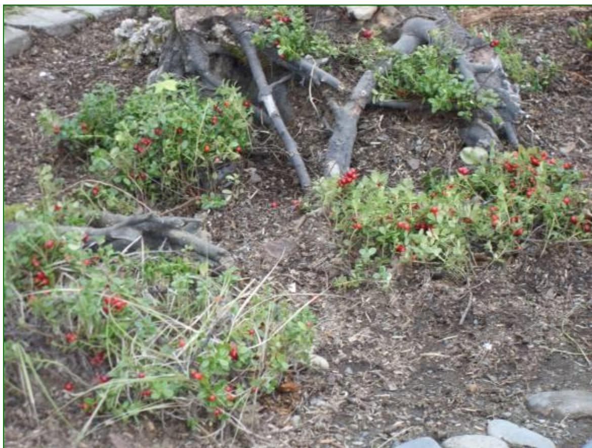
Брусника, растение хвойных лесов