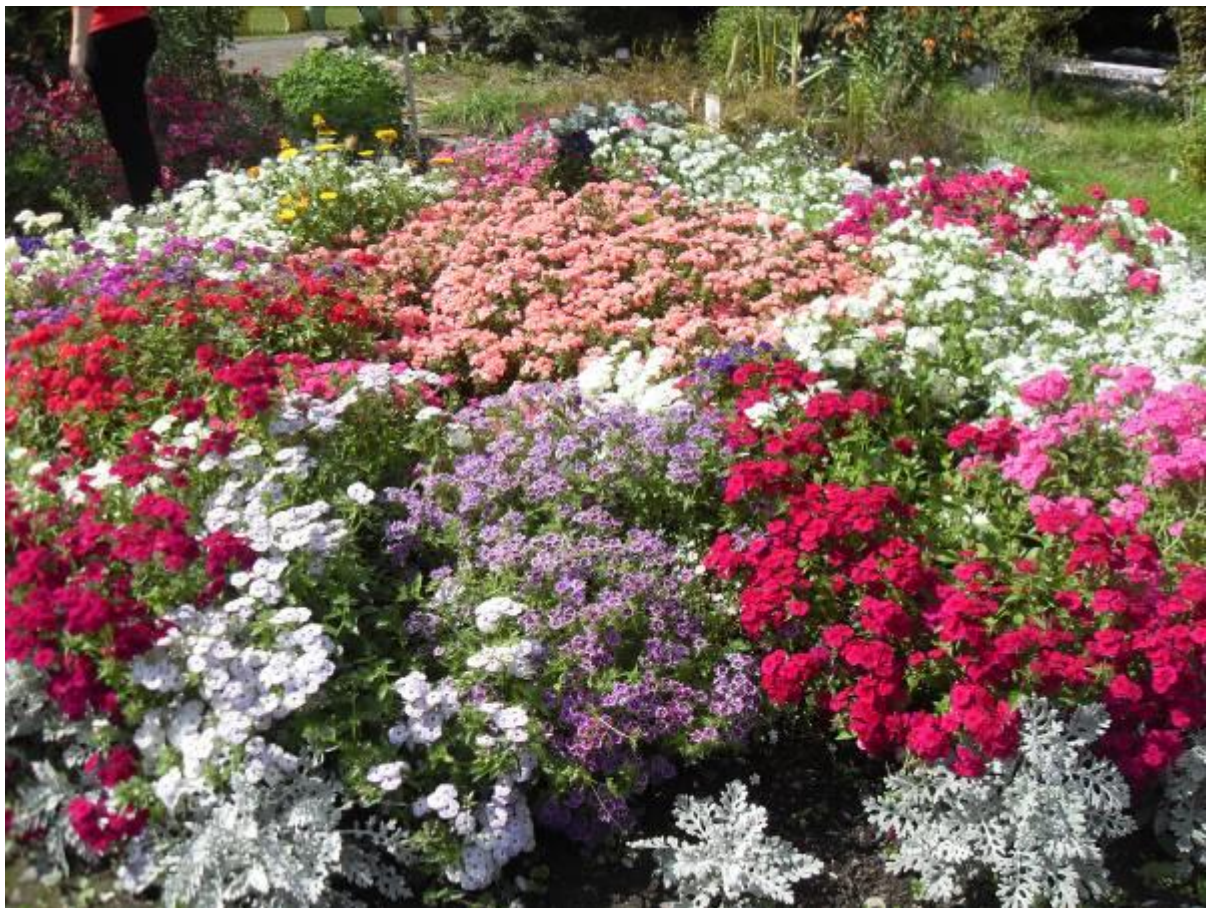
Виды учебно-экологической площадки