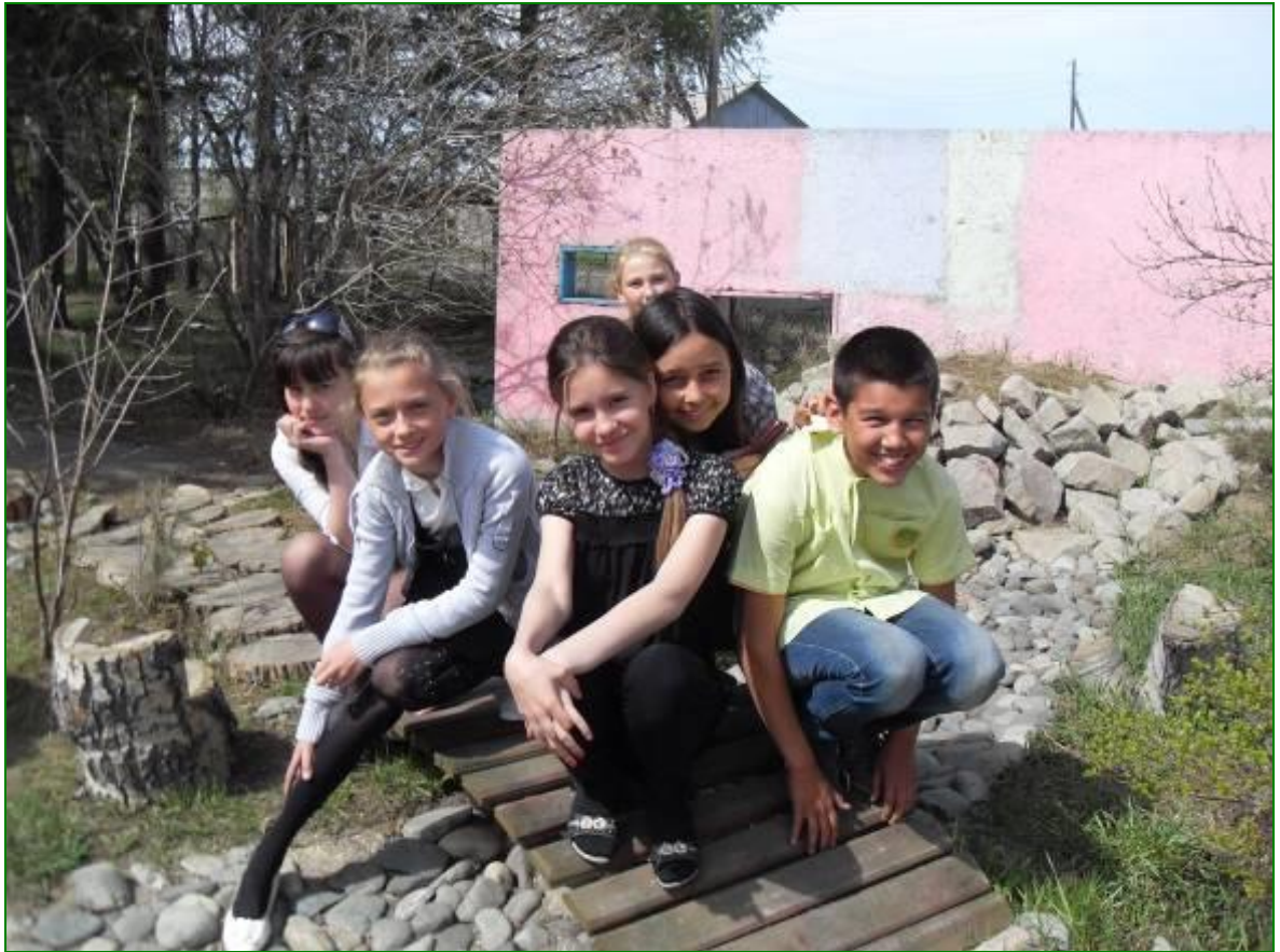
Сухой ручей, мостик через него