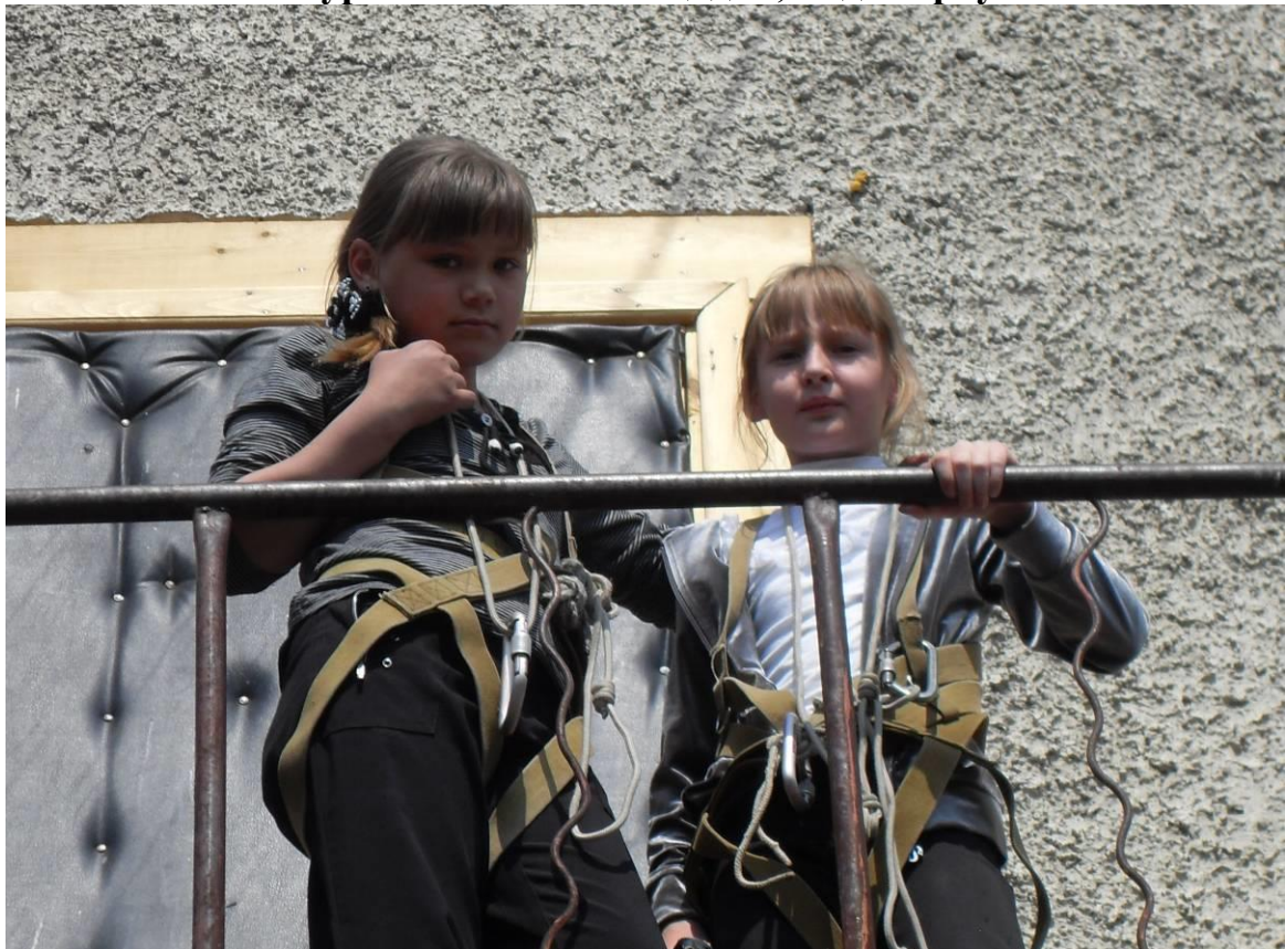
К переправе готовы