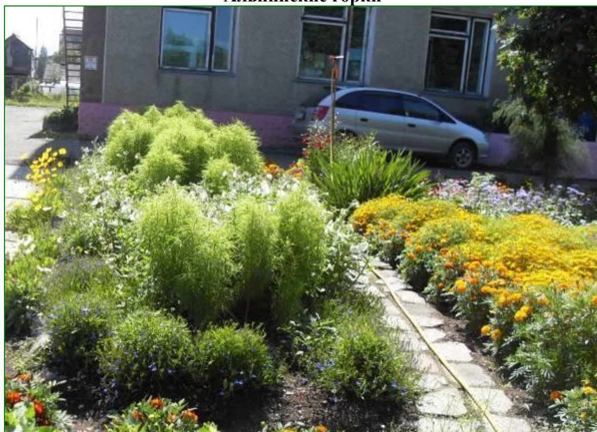
Виды учебно-экологической площадки