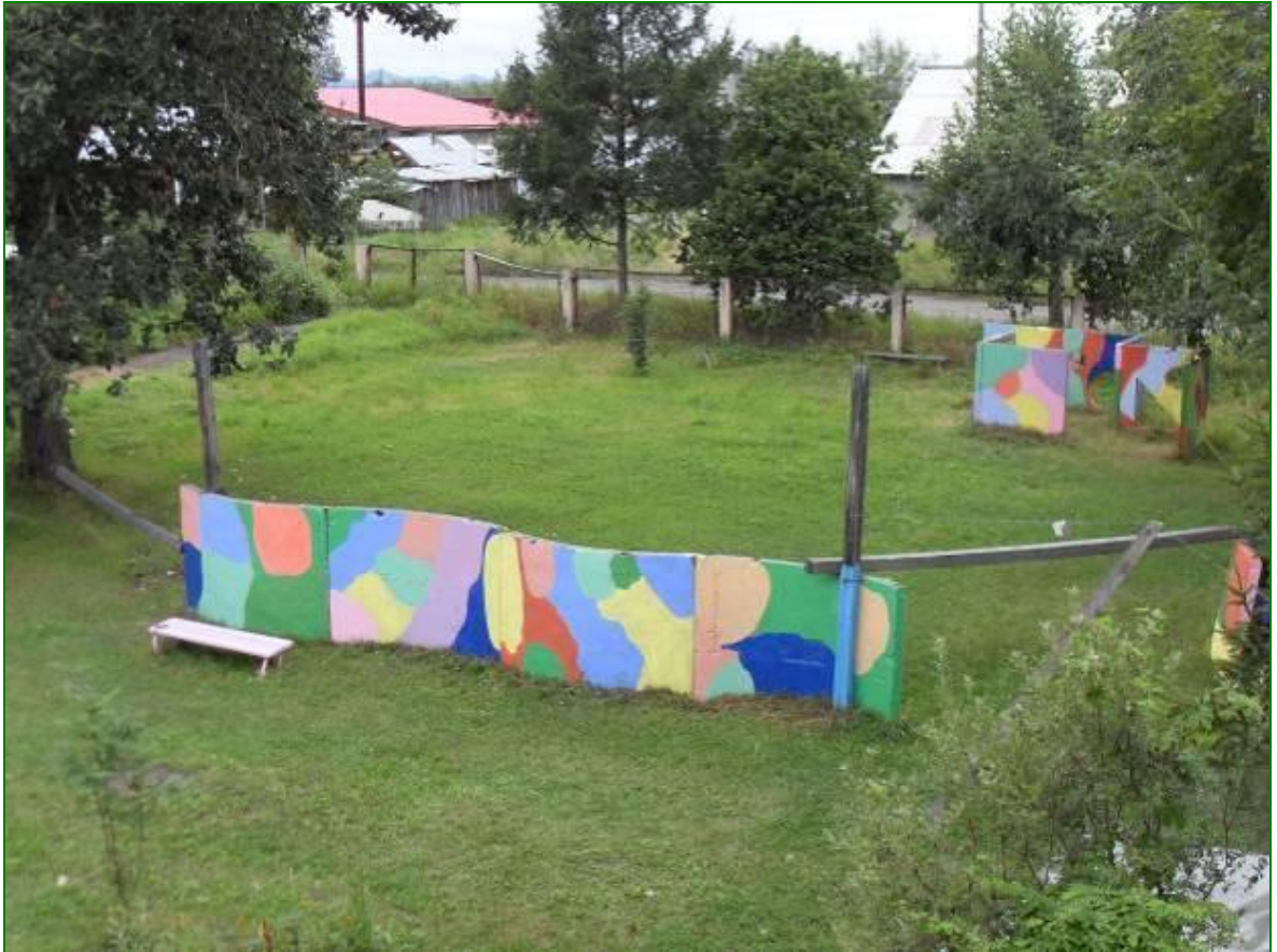
Туристическая площадка, вид сверху