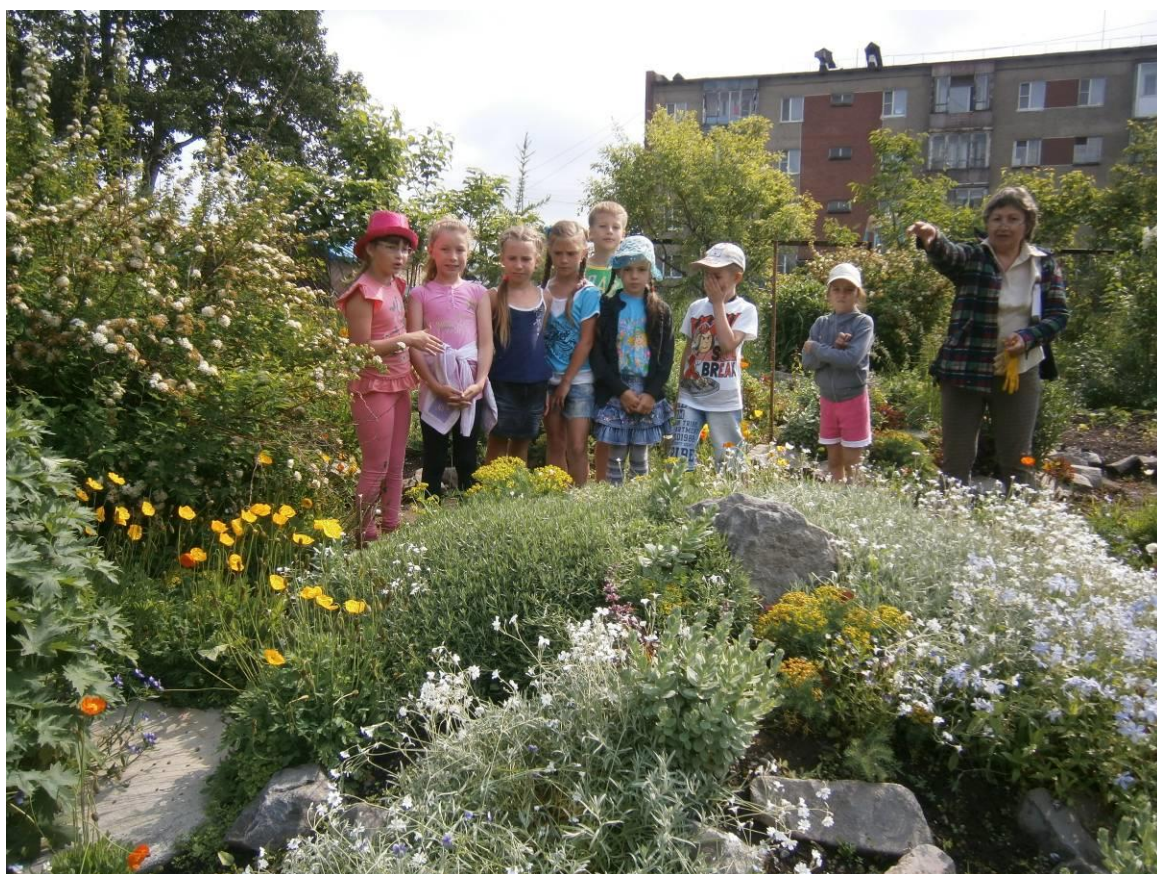
Экскурсия учащихся в Парке-музее