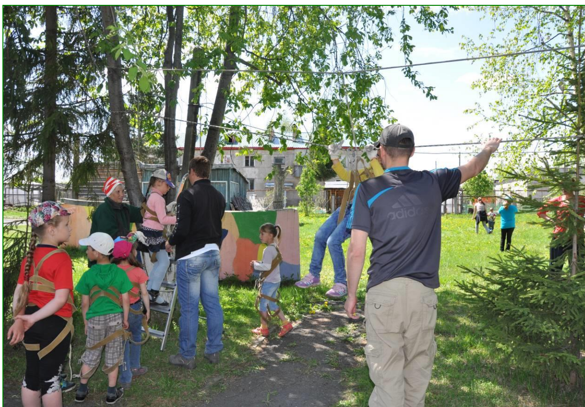
Во время соревнований