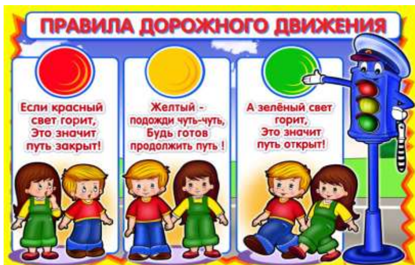
Виды и сигналы светофора.