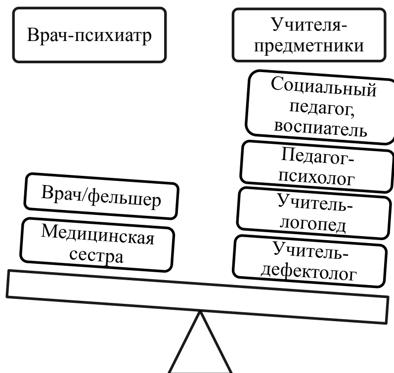
Рис. 2. Примерный перечень педагогических работников и специалистов, участвующий в реализации СИПР

Существенное внимание при разработке СИПР уделено разделению полномочий в реализации содержания образования обучающихся с умеренной, тяжелой и глубокой умственной отсталостью (интеллектуальными нарушениями, сложными дефектами) в условиях общеобразовательной организации и семьи. Для реализации СИПР общеобразовательная организация вправе иметь в своей структуре различные структурные подразделения, в том числе психологические и социально-педагогические службы, обеспечивающие осуществление образовательной деятельности, социальную адаптацию и реабилитацию обучающихся с умеренной, тяжелой и глубокой умственной отсталостью (интеллектуальными нарушениями, сложными дефектами). Примерный перечень педагогических работников и специалистов, участвующих в реализации СИПР, представлен на рисунке 2.