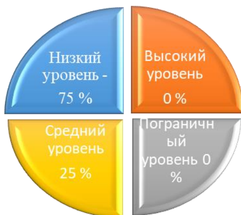
Начало учебного года