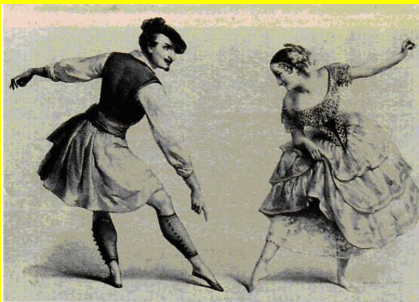
Arthur Saint-Léon et Marie Guy-Stéphan dans Le Lutin de La Vallée , lithographie d'A.F.