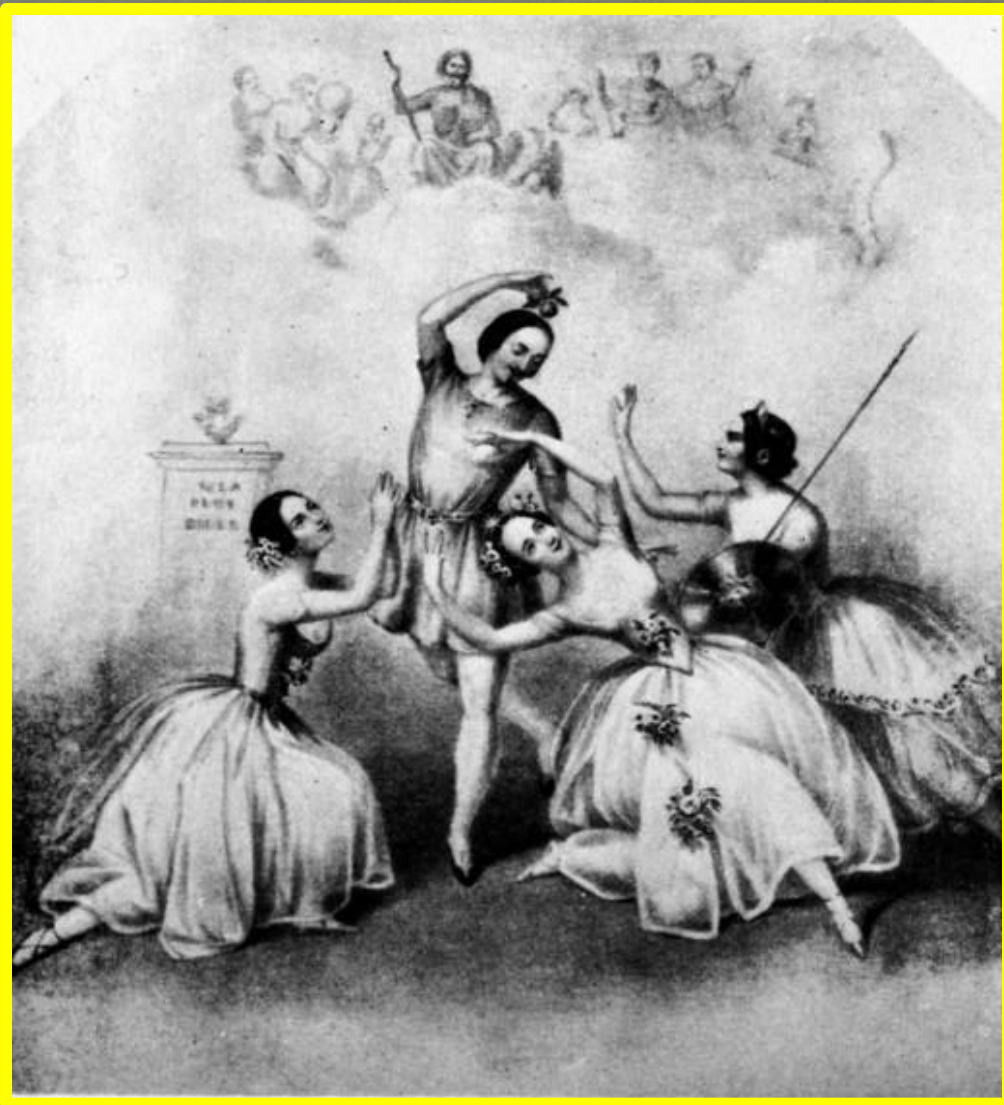
Фанни Черрито, Артур Сен-Леон, Мирия Тальони и Люсиль Гранн