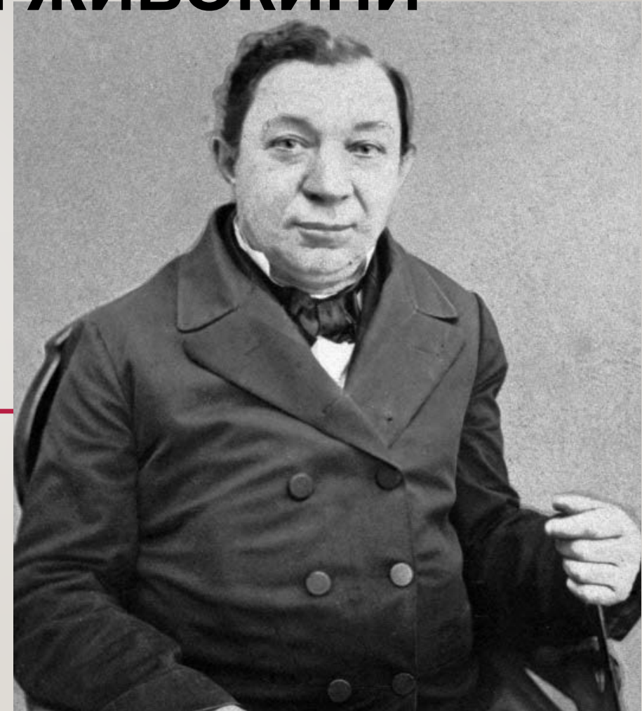
АКТЕРЫ «МОСКОВСКОЙ» ШКОЛЫ