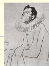
В.Э.Мейерхольд - Пьеро в пьесе Блока «Балаганчик»