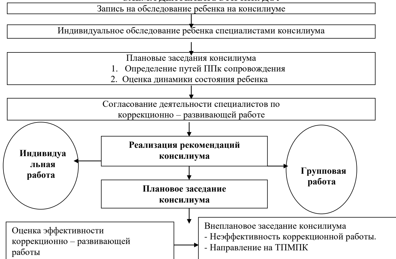
СХЕМА ДЕЯТЕЛЬНОСТИ ППк ДОУ

Содержание деятельности ППк обеспечивает: