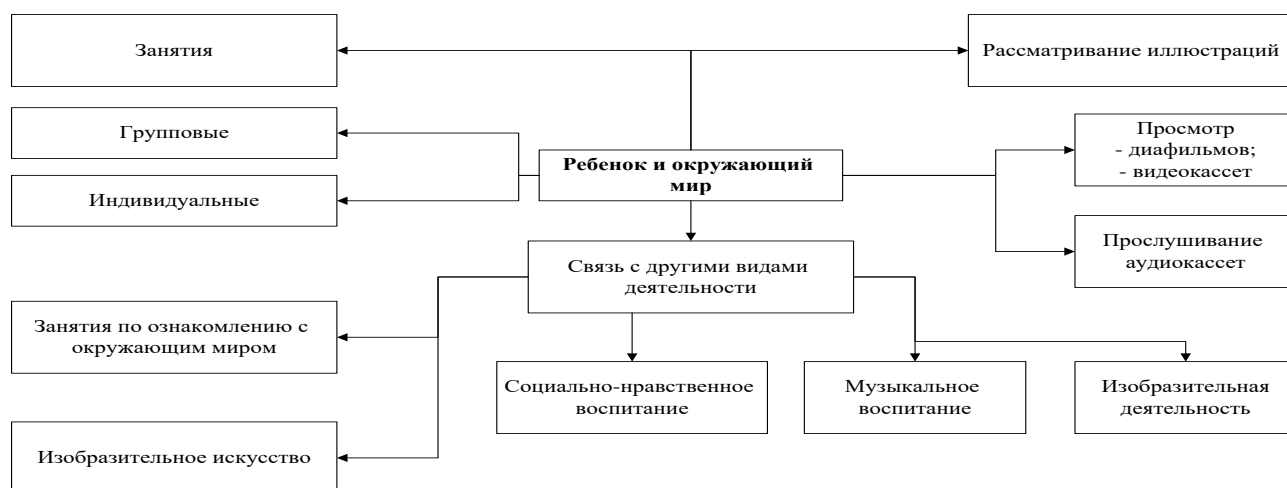
Схема работы по образовательной области «Познавательное развитие»