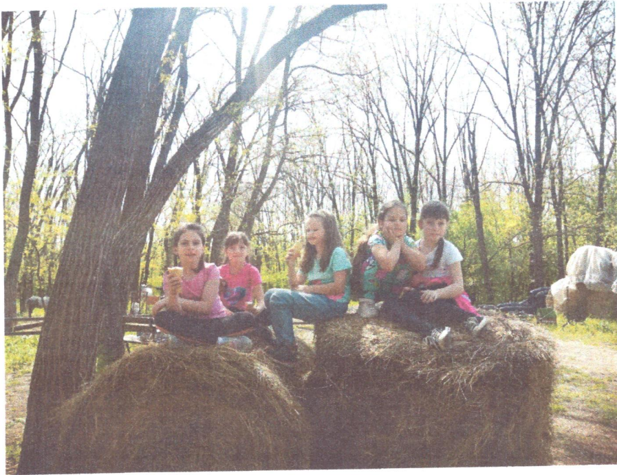
Учитель начальных классов

Экскурсия была тематическая – «Уход за лошадьми и обмундирование лошади». Во время экскурсии ребятам показали, как нужно расчесывать лошадь, как её чистят, одевают седло, узду, как лошадью управляют. Ребятам предложили попробовать самим поухаживать за лошадьми, на что дети, конечно, согласились с охотой. Ребята взяли щетки и расчески и приступили к работе. После этого дети с удовольствием катались на лошадях.