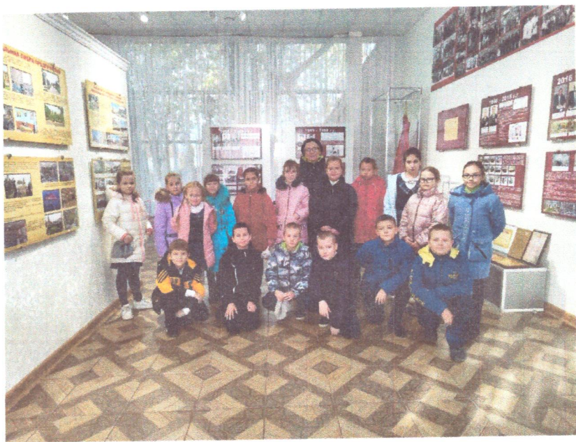
Учитель начальных классов

Побывали в цехах, постояли у сталеплавильной печи, видели работу крана и настоящие бронетранспортёры. В завершении школьникам гостеприимный экскурсовод привела в музей завода, где посмотрели документальный фильм о производстве, о военной технике, о ветеранах предприятия, о прошлом и настоящем БТРЗ-81.