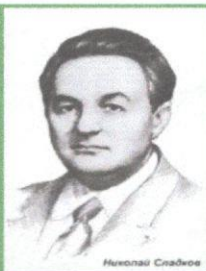
Николай Иванович Сладков (1920—1996)

В книгах замечательного ленинградского писателя Николая Ивановича Сладкова можно найти необычайно интересные и познавательные случаи из жизни живой природы, зверей и птиц.