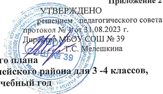
Таблица-сетка часов учебного плана МБОУ СОШ № 39 х. Трудобеликовского Красноармейского района для 3 -4 классов, по ФГОС НОО на 2023 – 2024 учебный год