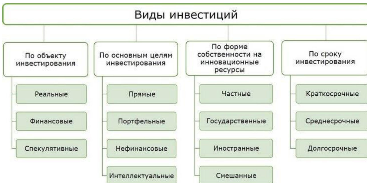
Рисунок 1 – Виды инвестиций

2. по формам собственности на инвестиционные ресурсы: