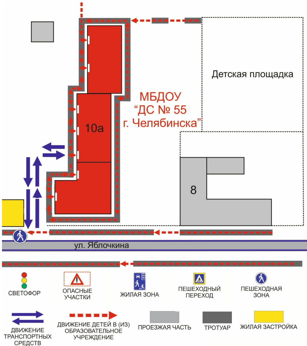
Схема организации дорожного движения в непосредственной близости от образовательного учреждения с размещением соответствующих технических средств, маршруты движения детей и расположение парковочных мест