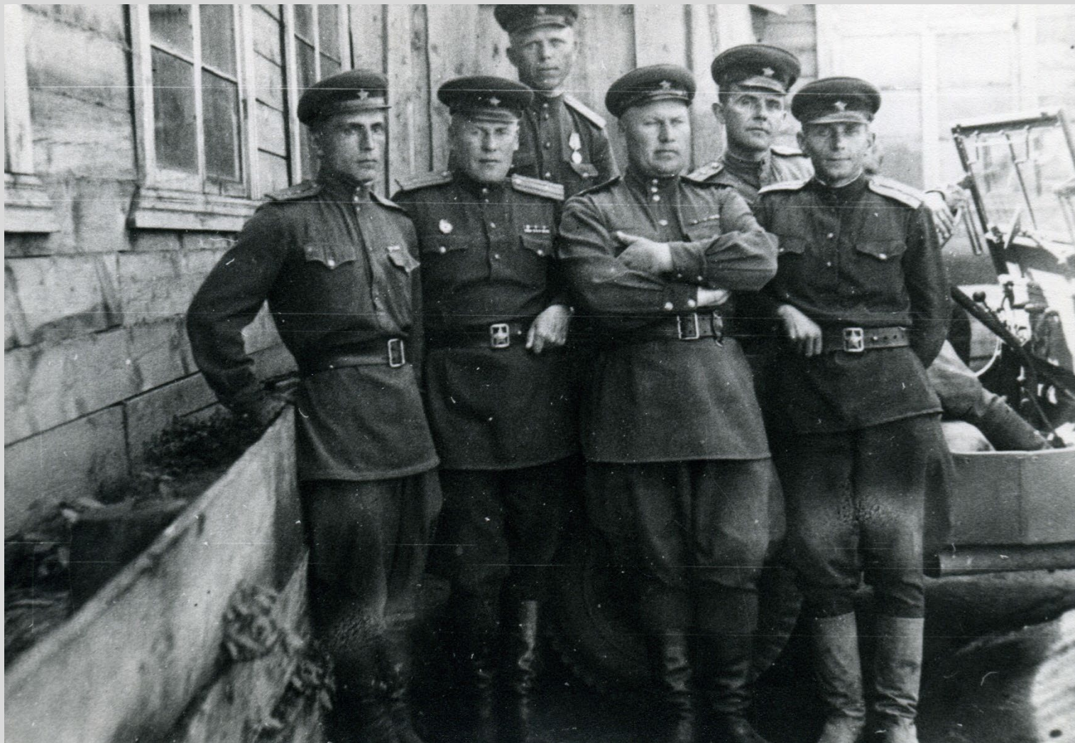
Командный состав 29 учебного танкового полка. Верхний Уфалей