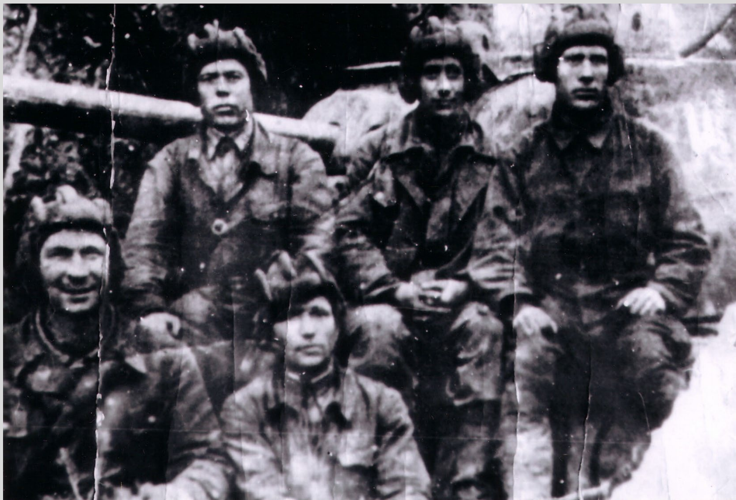
Челябинский добровольческий экипаж танка КВ-1 «Илья Муромец» Западный фронт, 1942 г.