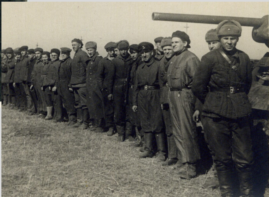
А. И. Киселева - единственная женщина-испытатель танков. Челябинск. 1943 г.