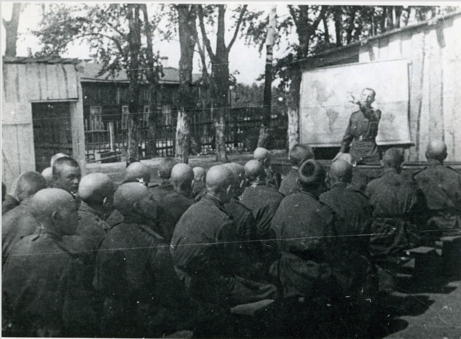
Политические занятия с молодым пополнением. 29-й учебный танковый полк. Верхний Уфалей, 1944 г.