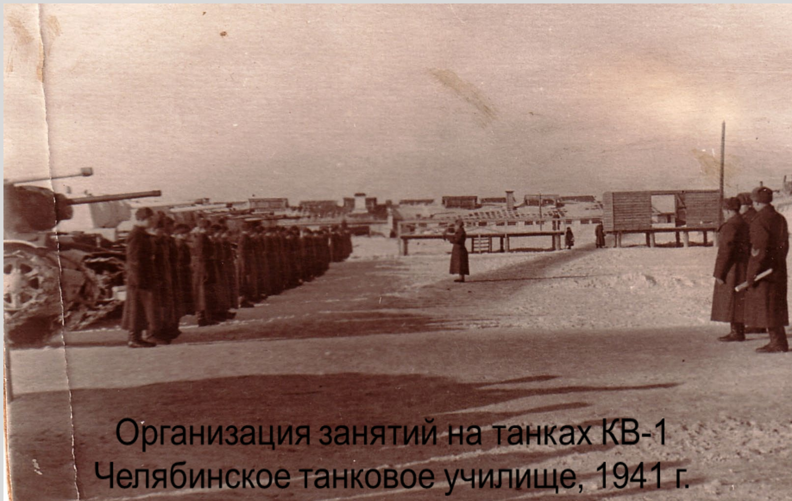
Организация занятий на танках KV-1 Челябинское танковое училище, 1941 г.

Военные училища и командные курсы выпустили более 40 тысяч офицеров-танкистов. В переломный 1943 год каждый третий офицер-танкист был с Урала.