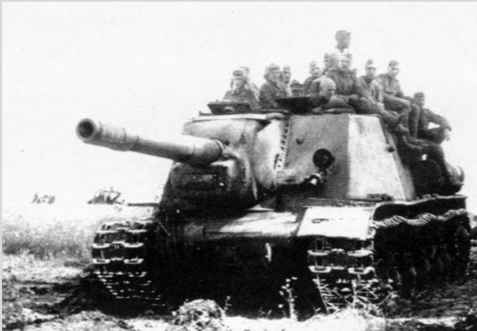
С марта по июль 1943 г. в Челябинске сформировано первые 16 тяжелых самоходно-артиллерийских полков. Челябинская САУ СУ-152 на Курской дуге. Лето 1943 г.