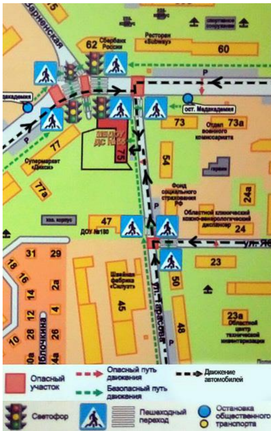
Схема организации дорожного движения в непосредственной близости от образовательного учреждения с размещением соответствующих технических средств, маршруты движения детей и расположение парковочных мест