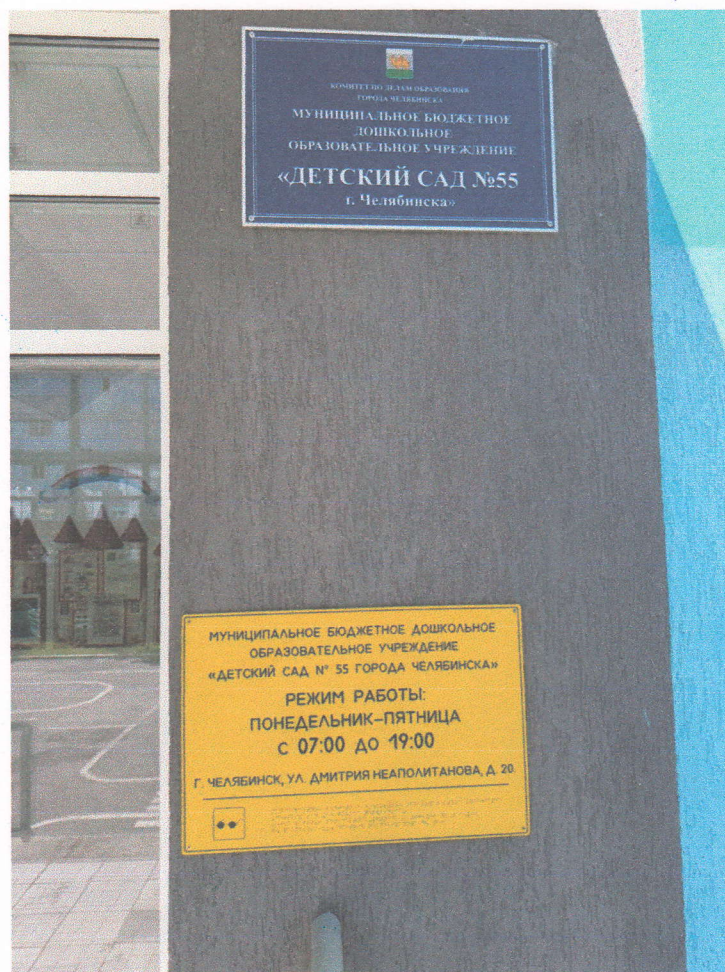
Фото № 8