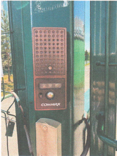
Φοτο Νο 2