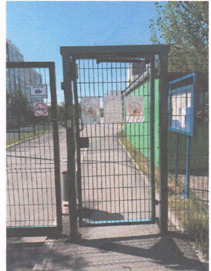
Φοτο Νο 3