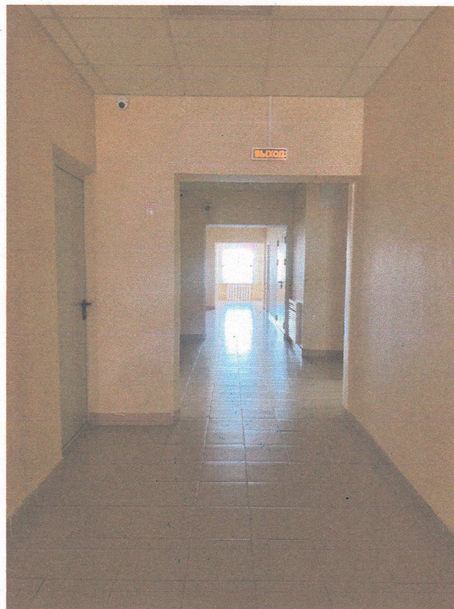
Φοτο Νο 4