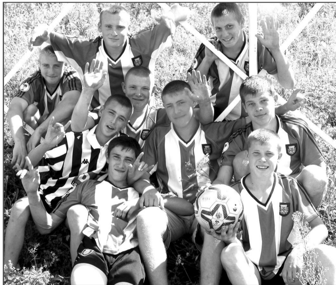
Не теряющие присутствия духа красноярские ребята.