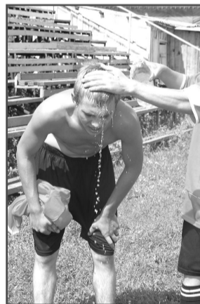
Холодный «душ», и снова в бой!