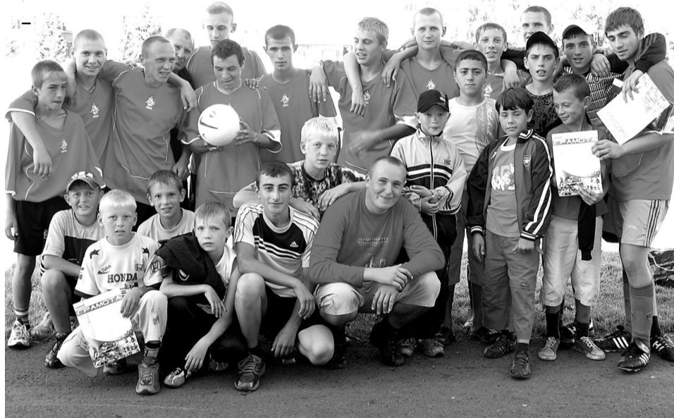
Победители – команда «Беловский-1» – свой успех объясняют просто: «Играем постоянно - методист у нас такой».