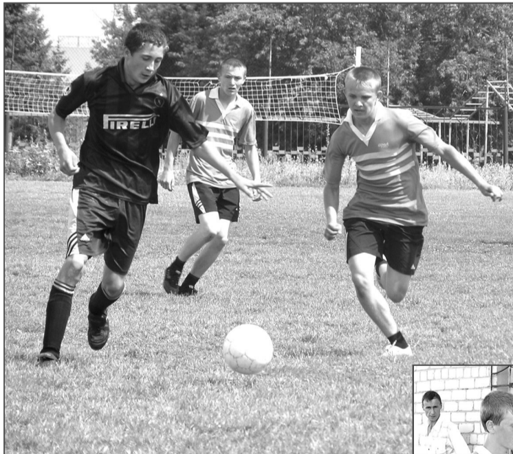
...И мяч уже в игре.