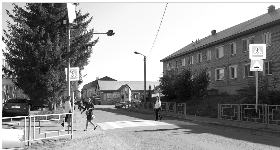
Пешеходный переход у Троицкой средней школы №2.

Конечно, правил дорожного движения очень много, и все подряд давать ребенку совсем необязательно. Он их просто не запомнит. Однако дети обязаны знать самые основные пункты правил и строго их выполнять. Во время совместных прогулок необходимо регулярно проверять, насколько ребенок усвоил эту информацию и следует ей.