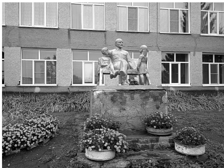
Тот, кто хоть раз побывал в Красноярской школе, уже не спутает ее ни с какой другой благодаря памятнику В.И. Ленину. Интересно, а есть ли где-то еще в России подобные памятники?