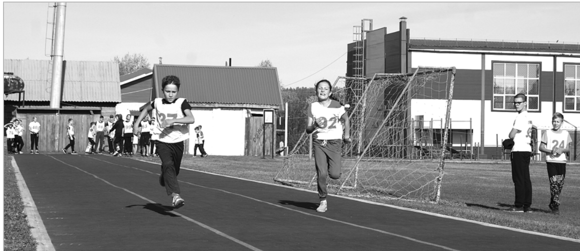
Начиная с 2019 года Всероссийский физкультурно-спортивный комплекс «Готов к труду и обороне» вошел в состав федерального проекта «Спорт – норма жизни!», который, в свою очередь, является частью нацпроекта «Демография» на период 2019-2030 гг.