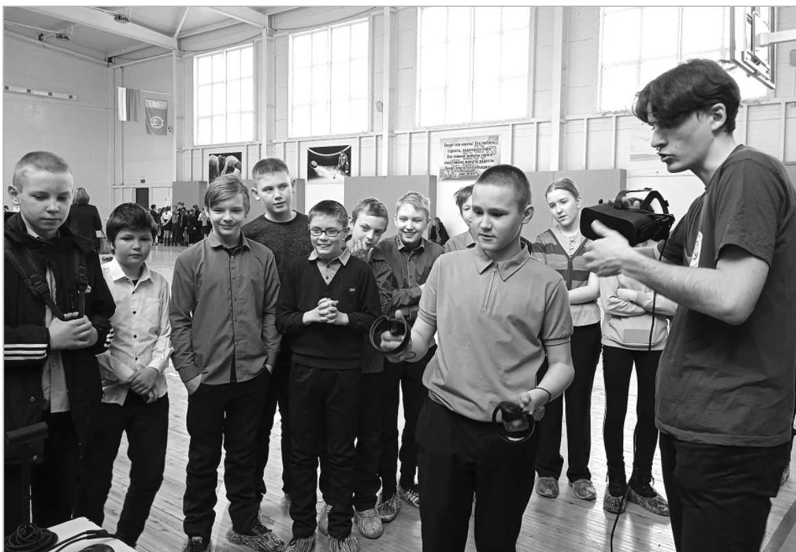
Желающих погрузиться в виртуальную и дополненную реальность среди мальчишек из Троицкой школы №1 было хоть отбавляй!

День открытых дверей мобильного технопарка, проходивший в этот раз в спортивном комплексе «Старт», посетили около 360 учащихся Беловской №1, Беловской, Боровлянской, Загайновской, Зеленополя-