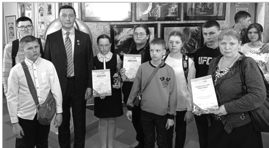
Делегация Детско-юношеского центра с космонавтом Сергеем Ревиным.

После пленарной части форума все участники разошлись по своим секциям. Наши участники представили свои творческие работы в секции «Фантастика и космос».