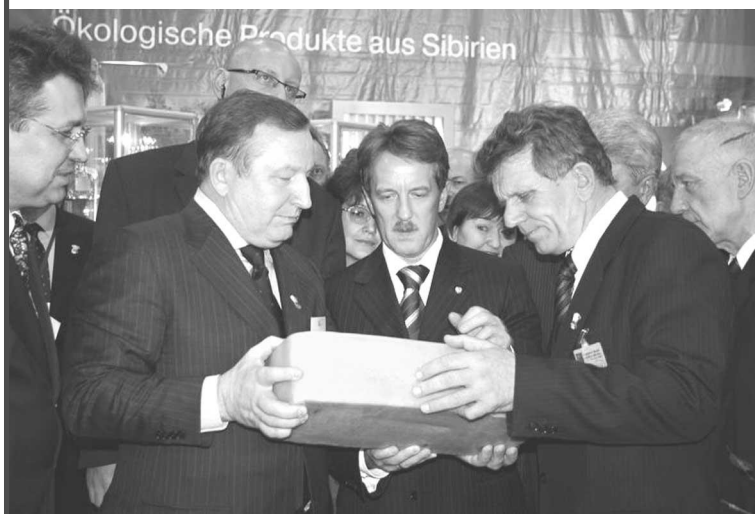
Министр сельского хозяйства РФ Алексей Гордеев (в центре) оценил алтайский сыр

54 диплома Минсельхоза РФ и организаторов «Зеленой недели» - такой «урожай» собрали алтайские сельхозтоваропроизводители на крупнейшей европейской ярмарке. За лучшее оформление стенда в российской экспозиции медалью и дипломом награждена администрация края. Поэтому можно сказать, что берлинская «Зеленая неделя» для Алтая стала «золотой».