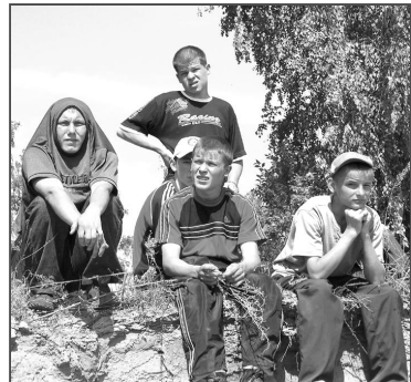
Жара – жарой, а пострелять охота!

Это был заключительный этап полевых сборов, которые проходили в школах с 5 по 9 июня согласно учебной программе. Парни изучали ведение общевойскового боя, оказание первой медицинской помощи и, конечно же, занимались