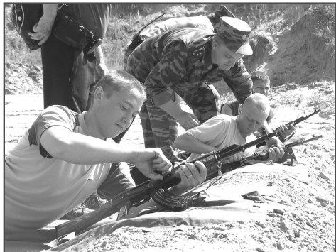
На огневой позиции.

Солнечным утром 9 июня у поста ГАИ на въезде в Троицкое выстроилась колонна автобусов, которая в сопровождении патрульных машин двинулась в Заводское. –Во, нас как высокопоставленных гостей сопровождают, – радовались мальчишки.