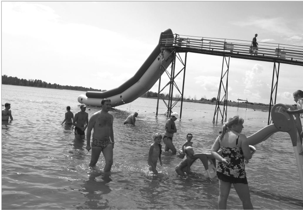
Для многих жителей нашего края и соседних регионов Гуселетовские озера Романовского района — вариант бюджетного отдыха.

По подсчетам геологов, запасы лечебных грязей достигают около 3 млн. тонн, учитывая возраст озера (около 12 тыс. лет), ежегодно должно накапливаться около 250 тонн этих отложений. Однако накопление ила происходит неритмично вследствие колебаний уровня озера, который подчинен режи-