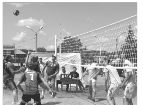
НЕ ПРОПУСТИТЕ! 13 августа состоится СОРЕВНОВАНИЯ ПО ГОРОДКАМ и ТУРНИР ПО ВОЛЕЙБОЛУ среди мужских команд. Начало в 11.00 на стадионе. Приглашаются все желающие.