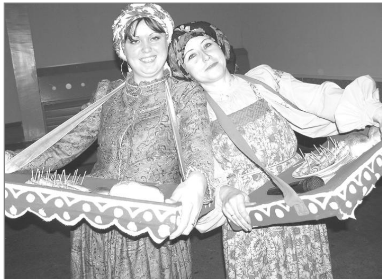
Шутками-прибаутками да вкусными пирогами завлекали на выставку хлебобулочных изделий нарядные лоточницы.