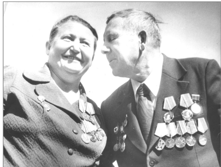
1965 год.