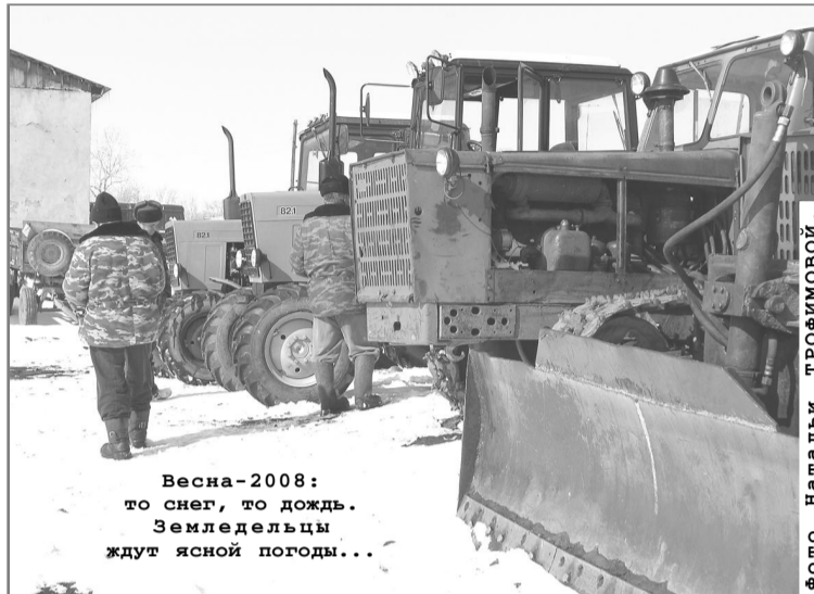
Весна-2008: то снег, то дождь. Земледельцы ждут ясной погоды...

– Проблем нет. Земли, что в Вершинине, взял барнаульский комбинат железобетонных изделий (КЖБИ. – Авт.). Руководство представило свой бизнес-план, создано новое предприятие – ООО «Вершининское». Планируют заниматься разведением мясного животноводства. В конце августа завезут 100 коров породы «казахская белолобая», телята будут оставаться с ними на подсосном