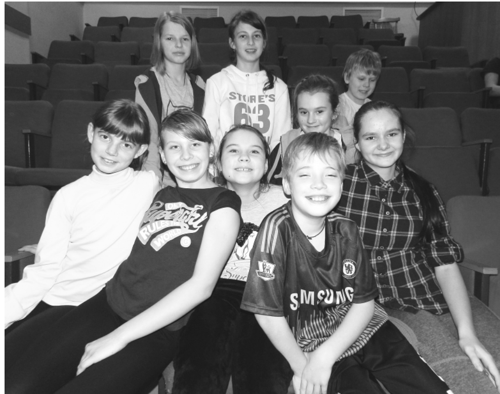
Дипломанты фестиваля-конкурса «Облепиха» – младший состав «Театра М»:

Сегодня в России более 600 современных и традиционных театров – драматических, музыкальных, эстрадных, детских.