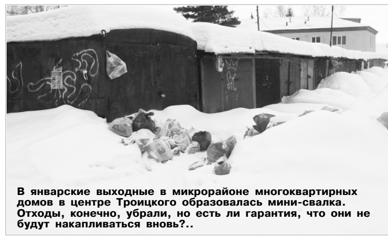
В январские выходные в микрорайоне многоквартирных домов в центре Троицкого образовалась мини-свалка. Отходы, конечно, убрали, но есть ли гарантия, что они не будут накапливаться вновь?..