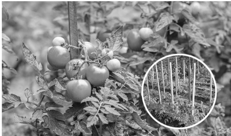
К покупке семян готовимся заранее!

«Снимающий ипотеку», «Лавандовые лягушачьи яйца», «Папин заход солнца», «Дуся красная», «Нужный размер», «Банановые ноги», «Семен безголовый» — не каждый догадается, что это названия сортов томатов.