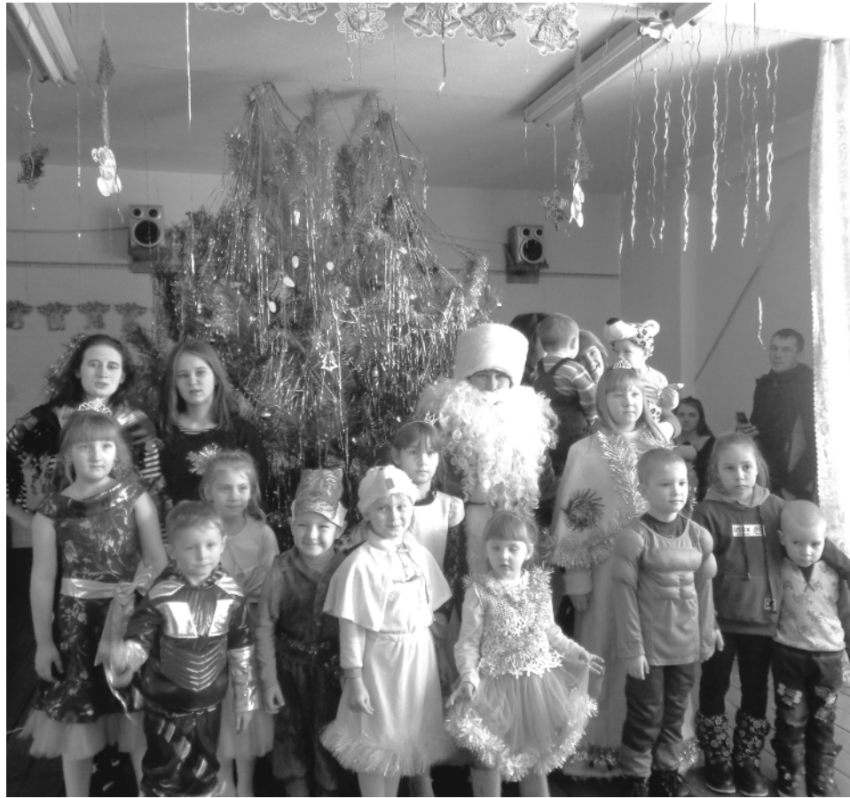
Дети пришли на представление нарядные, веселье в предвкушении праздника. И их надежды оправдались.

И. МИРКУШКИНА, работник культуры. С. Новоеловка.