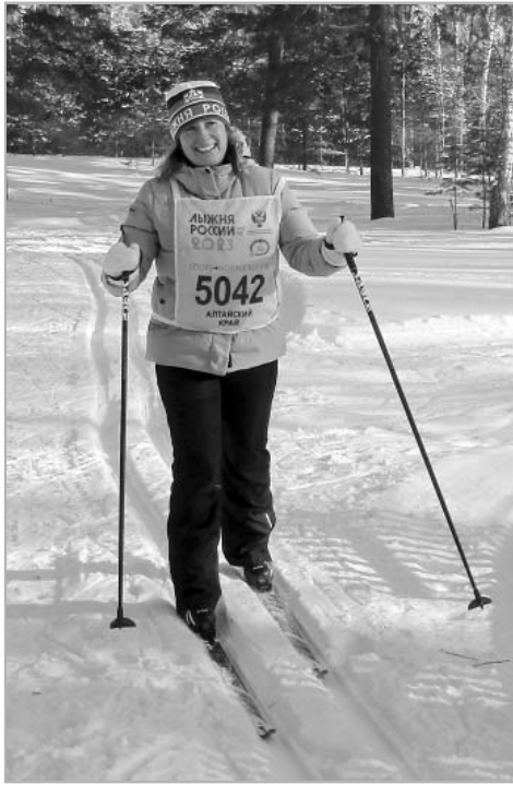
12 февраля в районе озера Пионерско-го состоялся масс-старт, в котором приняло участие около 40 человек.

НА ЛЫЖНОЙ БАЗЕ собрались любители здорового образа жизни, чтобы на соревнованиях помериться силами с земляками. Участники «Лыжня России» были разного возраста, — как говорится, от пионеров до пенсионеров.