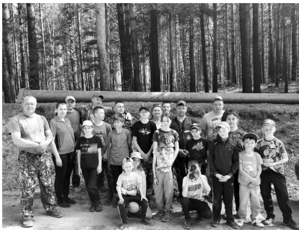
Экологическую акцию по уборке мусора в лесу провели в прошлом году вместе с ребятами ветераны Чечни и пограничной службы, педагоги Центра помощи детям.

питывать. Занятия мы проводим еженедельно, больше всего детям нравится стрелять — мы тренируемся в тире в техникуме. Девочки тоже проявляют интерес, и нередко они даже живее мальчишек — хоть в строевой подготовке, хоть в разборке пистолета Макарова. Некоторые ребята хотели бы стать кадетами.