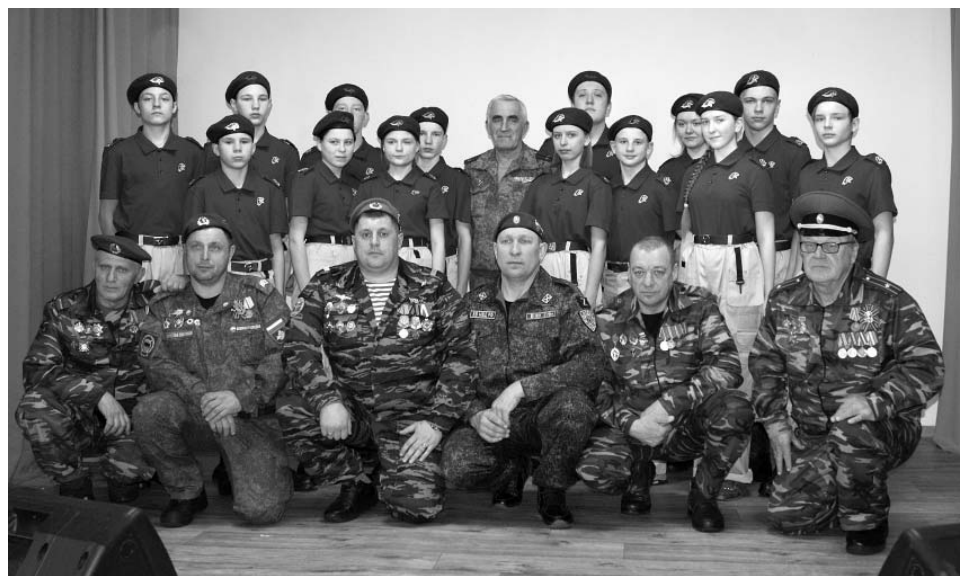
14 февраля в техникуме проходила встреча ветеранов боевых действий с молодежью. Ребята из военно-патриотических клубов «Патриот» и «Отечество» в этот день впервые надели юнармейскую форму.

— Прежде всего — интерес детей к занятиям, настрой их продолжать. Глазки у ребят горят, а это главное, что вдохновляет нас вести работу в военно-патриотических клубах. Ответственное, между прочим, это дело — работать с детьми, учить их чему-то, вос-