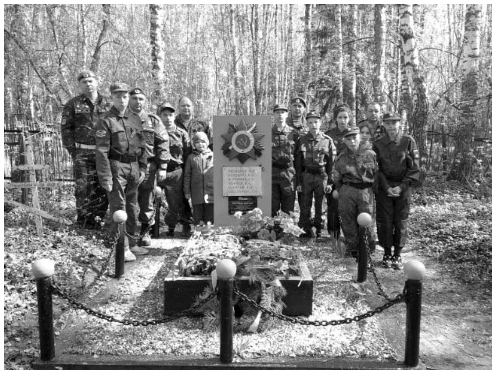
Вместе с ветеранами боевых действий ребята из Центра помощи детям ухаживают за братской могилкой бойцов, умерших в госпиталях в селе Троицком в годы Великой Отечественной войны, приносят цветы в праздник Победы.