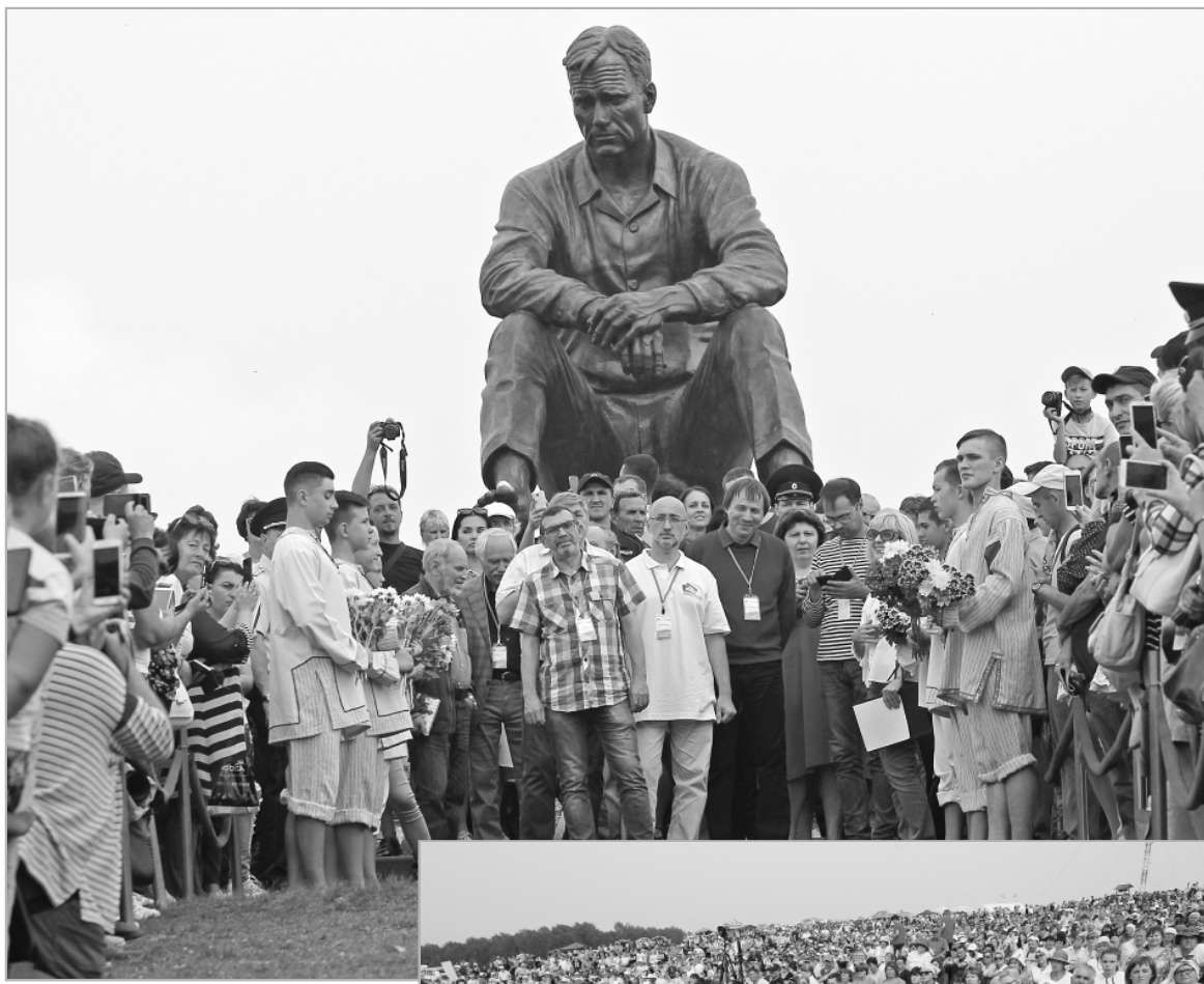
Десятки знаменитостей и тысячи почитателей творчества Шукшина в очередной раз собрались на Пикете.

Напомним: с 23 по 27 июля в Алтайском крае уже в 42-й раз